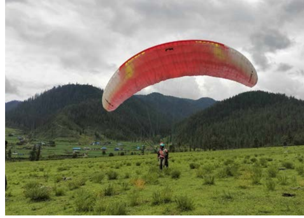
दिलमाया शाही/मध्यान्ह जुम्ला, २७ असार

जुम्लाको गुठीचौर गाउँपालिकामा प्याराग्लाइडिङ परीक्षण गरिएको छ। पर्यटकीय स्थल गुठीचौरको पर्यटन प्रवर्द्धन गर्न साहसिक खेल प्याराग्लाइडिङलाई व्यावसायिकरूपमा सञ्चालन गर्ने उद्देश्यसहित परीक्षण उडान गरिएको हो।