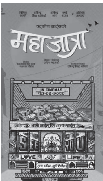
चलचित्रको अन्तर्राष्ट्रिय प्रदर्शन अधिकार खरिद गर्नुलाई 'जात्रा' शृंखलापतिको