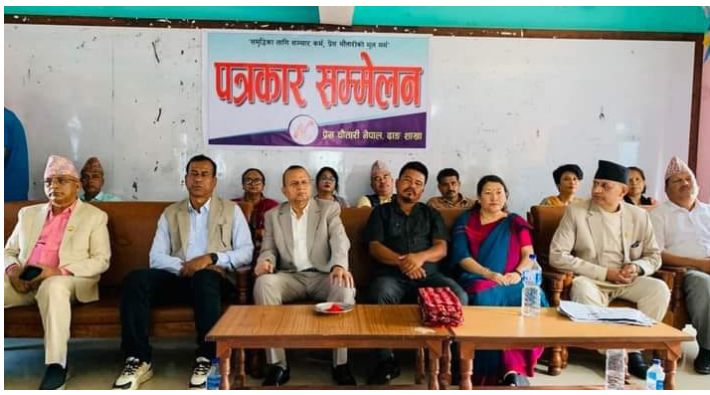
उनले जोड दिए। साना राजनीतिक दलहरूले अनावश्यक बागेनिङ गर्दा अस्थिर राजनीति सिर्जना भएको उनले दावी गरे।