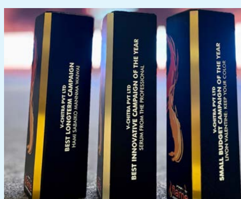
अवार्डद्वारा सम्मानित भएको छ । भि-चित्रले ख्यातीप्राप्त

काठमाडौं/मस- नेपाली विज्ञापन एजेन्सी भि-चित्रले भारतको प्रतिष्ठित पुरस्कार प्राप्त गरेको छ । भि-चित्रले 'रुरल मार्केटिङ एसोसिएसन अफ इन्डिया' द्वारा भारतमा आयोजित 'फ्लेम अवार्ड २०२४' समारोहमा नेपालको अग्रणी विज्ञापन एजेन्सी भि-चित्रले २ स्वर्ण र १ रजत पुरस्कारका साथ उच्च सम्मान प्राप्त गरेको छ । भि-चित्रले लोकप्रिय नेपाली तयारी चाउचाउ ब्राण्ड वाइवाइको लागि सञ्चालन गरेको 'हामी सबैको मनमा वाइवाइ' उत्कृष्ट लामो अवधिको अभियान र कपालको हेरचाह सम्बन्धिको ब्राण्ड 'लिभोन' को लागि गरिएको क्याम्पेन 'किप योर कलर्स' वर्षको उत्कृष्ट बजेट क्याम्पेन घोषित हुँदै गोल्ड अवार्ड प्राप्त गरेको छ ।