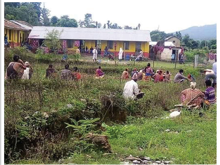
ज्यान लिने क्वारेन्टिन: पूर्वी सुर्खेतको गुर्भाकोट नगरपालिका-७ स्थित सिरुवानी विद्यालयको क्वारेन्टिन। उक्त क्वारेन्टिनमा सोमबार एक ४८ वर्षीय पुरुषको ज्यान गएको छ।