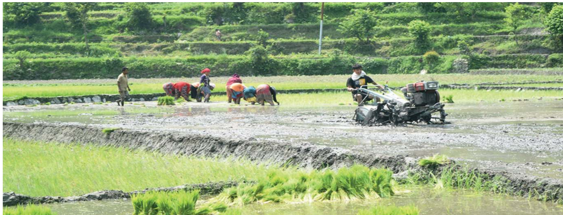
म्याग्दीको मंगला गाउँपालिका-२ रनबाङमा ट्याक्टरले खेत जोतेर धान रोपाईं गर्दै किसान ।

जंगली च्याउहरू विषालु पनि हुनसक्छन्, त्यसैले राम्ररी पहिचान गरेर मात्र खाऔं ।