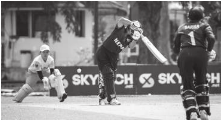
नेपालले विजयी शुरुवात गरेको छ ।