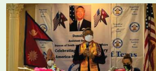
शिवराज परियार/मध्यान्ह काठमाडौं, ३ असार ।

अमेरिकी सहायक विदेशमन्त्री लुले चीनको नाम नलिइ नेपालको सबैभन्दा ठूलो छिमेकीले एसपीपीमा अनावश्यक खेल्नरहेको आरोप लगाएका हुन् ।