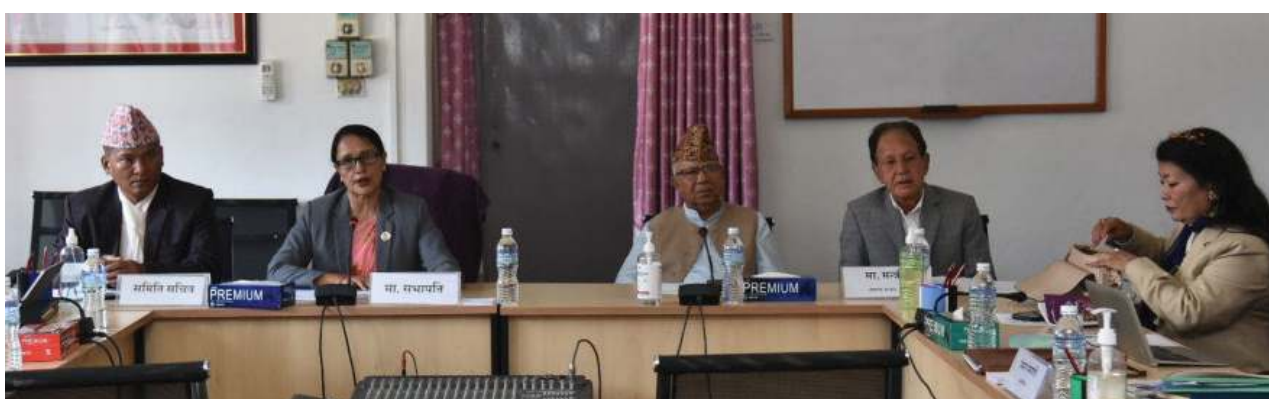
दिव्य अधिकारी/मध्यान्ह काठमाडौं, ३ असार ।

सन् २०१५ देखि नै औपचारिक प्रक्रिया पहल भएर सन् २०१९ मा अमेरिकाले स्वीकार गरिरहेको एसपीपीबारे बहस सतहमा आइपुग्दा दलहरूलाई यसबाट पछि नित्तै सफलता परेको छ । कुनै न कुनै बेला यसमा जोडिएका दलहरू जनतावधि अस्वीकार गर्नेमा एक भएका छन् ।