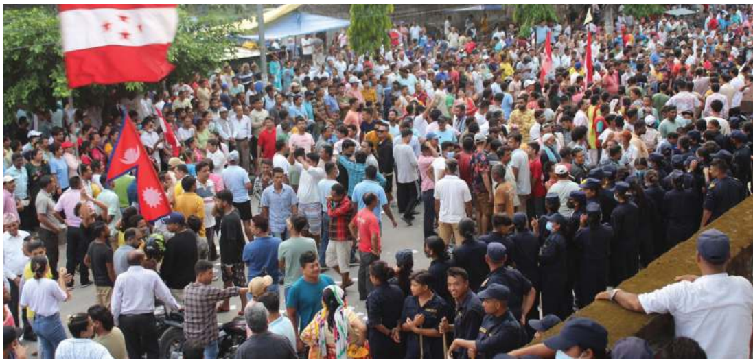
बुटवल उपमहानगरपालिकाको चुनावी नतिजा कुट्टे कांग्रेस नेतृत्वको जाठबन्धनका समर्थकहरु ।