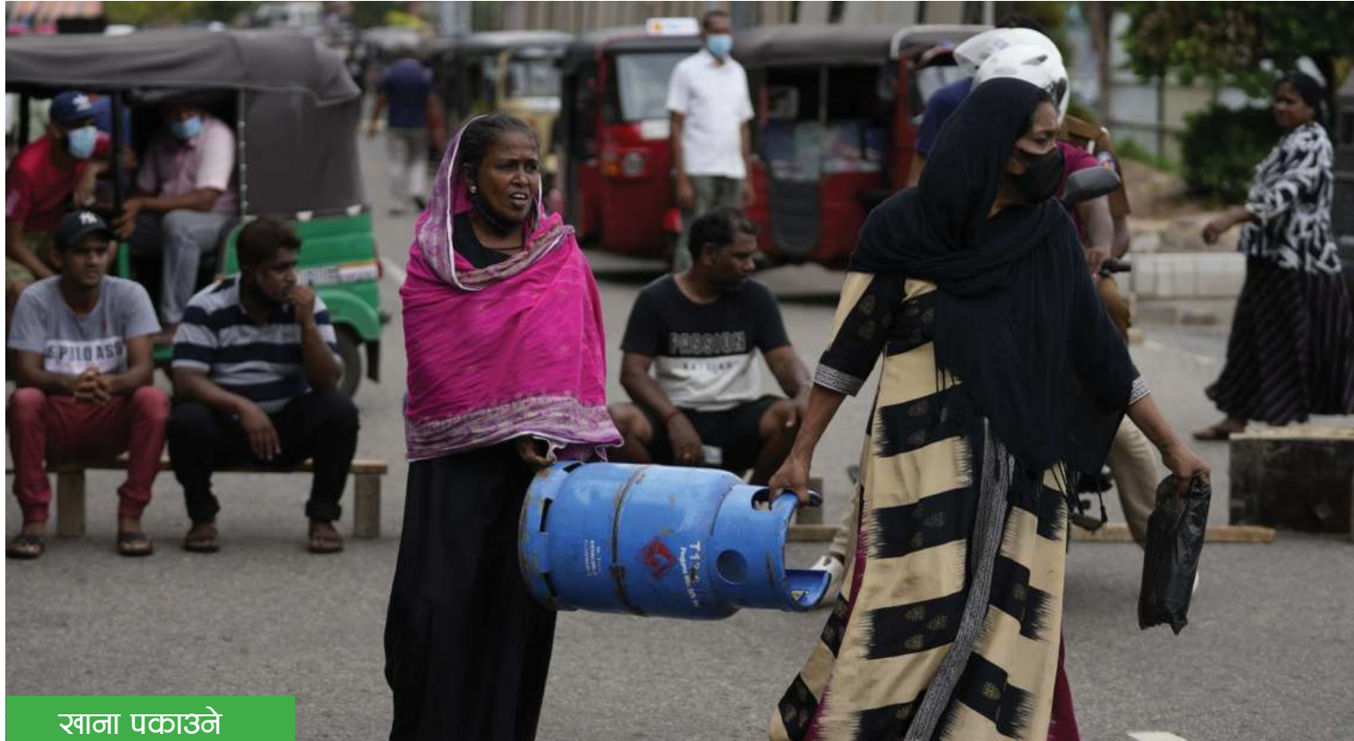
खाना पकाउने ज्याँसको अभाव