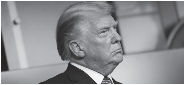
न्याय मन्त्रालयलाई सिफारिस गरेको हो। सात डेमोक्रेट र दुई रिपब्लिकनले एक

काठमाडौं/एजेन्सी- अमेरिकी संसदीय समितिले पूर्वराष्ट्रपति डोनाल्ड ट्रम्पविरुद्ध फौजदारी अभियोग लगाउन सिफारिस गरेको छ।