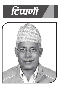
● ज्योतिलाल बन

सशस्त्र संघर्षका क्रममा कतिपय मानवताका सीमाहरू नाघेको भए पनि जनयुद्धको मध्यकालतिर आइपुग्दा तत्कालिन राज्यसत्ताको सातो उडाउने 'सिंह' जस्तै बनेको थियो नेकपा (माओवादी) । शोषक उत्पीडकहरू र यिनको हितरक्षक अर्थसामन्ती राज्यसत्ताको विनाशक जस्तै भएर विकास भएको माओवादी तमाम शोषित उत्पीडित र विभेदमा पारिएका तल्लो तहका जनसमुदायको मुक्तिका निमित्त भरोसाको केन्द्र नै बन्न पुगे भन्नु लायको । निर्णायक कारण १९ दिने जनआन्दोलन देखिए पनि मूलतः माओवादी 'जनयुद्ध'कै कारण नेपालबाट राजतन्त्रको अन्त्य भई संघीय लोकतान्त्रिक गणतन्त्र स्थापना हुन सकेको थियो । जसलाई नेपालको इतिहासमा अभूतपूर्व परिवर्तन मान्न सकिन्छ । तर, शान्ति प्रक्रियामा आएपछि माओवादी नेतृत्व आफ्नो क्रान्तिकारी मान्यतामा दृढ रहन सकेन । यो यथास्थितिपरस्त संसदवादीहरूको घुमाई र चंगुलमा फस्न पुग्यो । सत्ताको लालचाले पनि यसलाई पथभ्रष्ट बनाउँदै लगे । पहिलो संविधानसभामा तयार पारिएको अग्रगामी रूपान्तरणमुखी