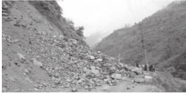
पाल्पा, २ साउन