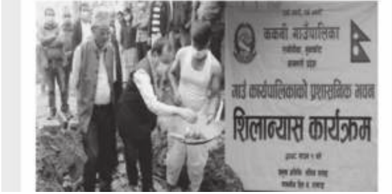
नुवाकोट, २ साउन