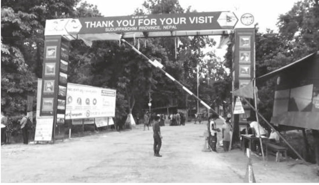
हिमेश बिक्रम/मध्याह्न धनगढी, २ साउन

सुदूरपश्चिम प्रदेशमा नेपाल-भारत खुला सीमानाका कारण लागूऔषधको जालो फैलिएको निष्कर्ष प्रहरीको छ। ११ महिनामा प्रदेशका ८ जिल्लाबाट तीन सय ४३ जना प्रयोगकर्ता पक्राउ गरेको प्रहरीले मुख्य समस्या खुला सीमाना भएको निष्कर्ष निकालेको हो। कारोबार भारतमा र प्रयोग नेपालमा हुँदा नियन्त्रणमा पनि चुनौती देखिएको छ। भारतसँग सिमाना जोडिएका कञ्चनपुर र कैलालीबाट गत आर्थिक वर्ष २०७७/०७८ मा सबैभन्दा बढी लागूऔषधका प्रयोगकर्ता पक्राउ परेका छन्।