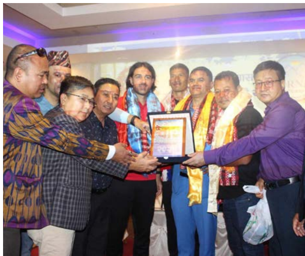
अन्जान गभाजु/मध्यान्ह दममा, २३ जेठ

फिफा विश्वकप २०२६ र एसियन कप छनोट अन्तर्गत दोस्रो चरणमा यूएईविरुद्धको 'होमफर्' र यमनविरुद्धको 'अवेफर्' खेल खेल्न साउदी अरब पुगेको नेपाली राष्ट्रिय फुटबल टोलीलाई साउदी अरबमा स्वागत तथा सम्मान गरिएको छ। शुरुवात साउदीको पूर्वी क्षेत्र दमामको होलिडे इन होटलमा नेपाली दूतावास रियाद तथा नैराबासी नेपाली संघ (एनआरएनए) साउदीको संयुक्त आयोजना खेलाडीहरूलाई सम्मान गरिएको हो। कार्यक्रममा साउदी अरबका