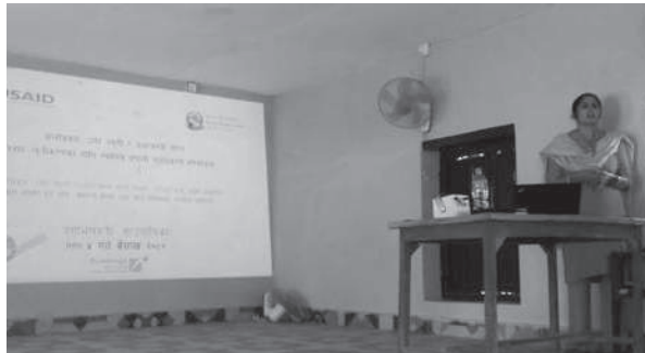
प्रेमचन्द्र झा/मध्यान्ह रौतहट, ४ वैशाख

मधेशका जिल्लामा बालविवाह हुनुको प्रमुख कारण इज्जत जाने डर रहेको एक अध्ययनले देखाएको छ । रौतहटको दुर्गा भगवती गाउँपालिकाले गरेको एक अध्ययनले यस्तो देखाएको हो । गाउँपालिकाको कुल जनसंख्या २४ हजार २ सय ५१ रहेको । ३ हजार ९ सय ५२ घरधुरीमा सर्वेक्षण गर्दा विवाह गरेकामध्ये ४३ प्रतिशतले बालविवाह गरेका प्रतिवेदनमा उल्लेख छ ।