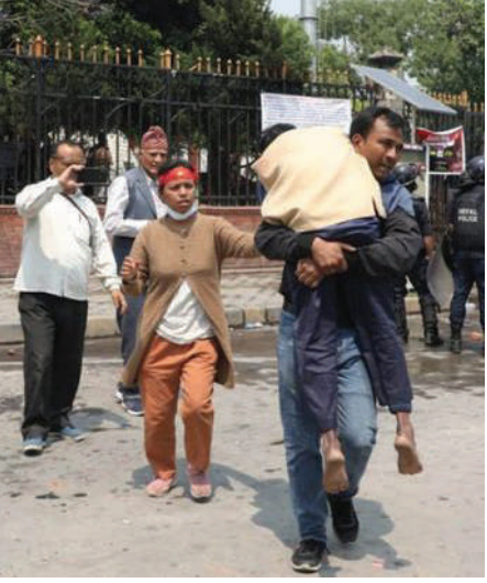
विवाकर अधिकारी / मध्यान्ह काठमाडौं, ४ वैशाख ।

मिटरब्याज पीडितको मागबारे निरन्तर छलफल चलिरहे पनि आन्दोलन रोकिएको छैन। बरु सरकार आन्दोलनरत मिटरब्याज पीडितप्रति रुष्ट हुन थालेको छ।