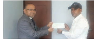
हजार रुपैयाँसम्मको आकर्षक छुट पाउनेछन् । यस किसिमको सहकार्यबाट बैंकका ग्राहकहरू

काठमाडौं/मस - सिटिजन्स बैंक इन्टरनेसनल लिमिटेड र भूकृषिमण्डप, काठमाडौं स्थित जामुनी अटो सेन्टर प्रा.लि. बीच सिटिजन्स बैंकका कार्डवाहक ग्राहकहरूलाई विशेष छुट दिने समझदारीपत्रमा हस्ताक्षर भएको छ । सो समझदारीपत्रमा हस्ताक्षर पश्चात् सिटिजन्स बैंकका कार्डवाहकहरूले जामुनी अटो सेन्टरमा स्कुटर खरिद गर्दा २५