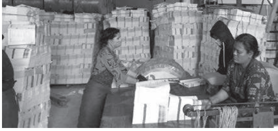
मध्याह्न संवाददाता काठमाडौं, ४ वैशाख

यही वैशाख १ गतेबाट नयाँ शैक्षिक सत्र शुरू भएको छ। नयाँ शैक्षिकसत्र शुरू भएसँगै देशभरका ५९ जिल्लाका विद्यालयहरूमा पाठ्यपुस्तक पुगेको छ। गत चैत २४ गतेदेखि वैशाख ३ गतेसम्म देशभरका ५९ जिल्लाका विद्यालयहरूमा पाठ्यपुस्तक पुगेको जनक शिक्षा सामग्री केन्द्रले जनाएको छ।