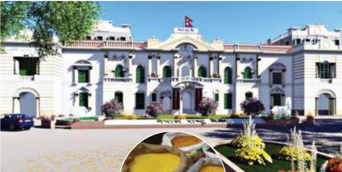
नारायण अर्याल/मध्याह्न काठमाडौं, ८ साउन ।

आर्थिक वर्ष २०७८/८९ को चौथो त्रैमासिक अवधिको अपेक्षित मुद्रास्फीति सर्वेक्षणको नतिजा सार्वजनिक गर्दै नेपाल राष्ट्र बैंकले आगामी ३ महिनामा मूल्यवृद्धि हुने जनाएको छ । नेपाल राष्ट्र बैंकले सार्वजनिक गरेको सर्वेक्षण तथ्यांकअनुसार नैर-खाद्य र सेवा तथा घरजग्गा (आवास) बाहेकका सम्पूर्ण उपभोग समूहहरूमा आगामी तीन महिनामा मूल्य वृद्धि