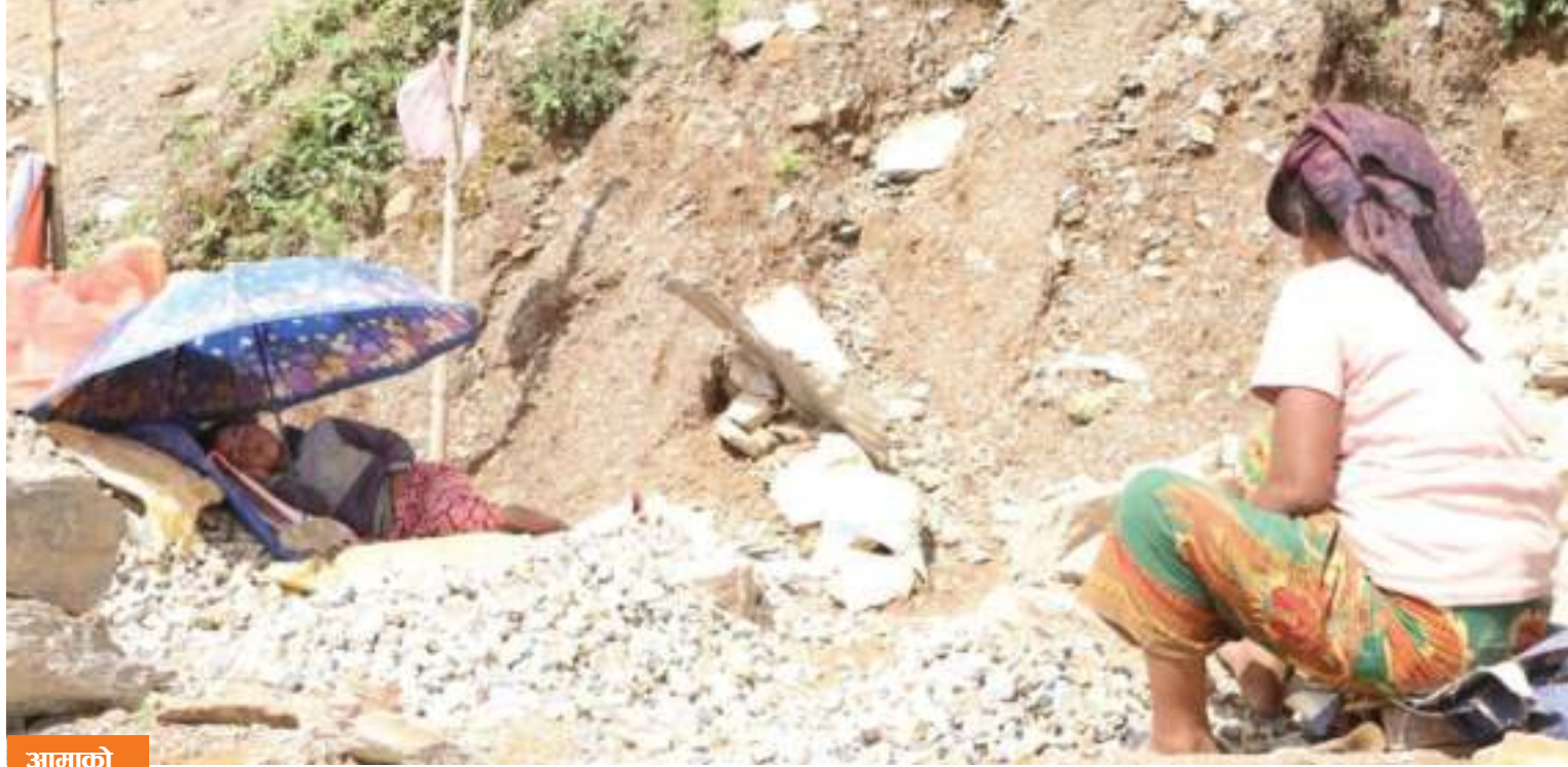
आगामी काठमाडौं गुल्मीको रेसुङ्गामा आफ्नी छोरी नजिकै सुताएर गिट्टी कुट्दै महिला ।