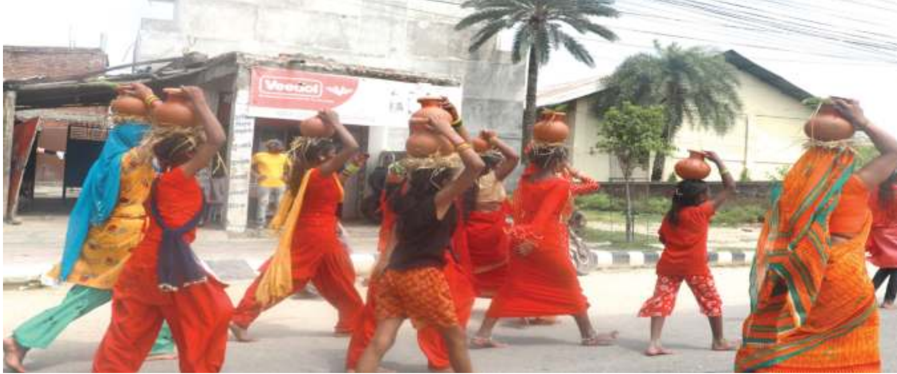
जन्तपुर उपमहानगर पालिकाका विभिन्न स्थानबाट बोलबम मेलाका सहभागी हुँदै । साउनभर मुलुकका शिवालयहरुमा बोलबम मेला लाग्ने गर्छ ।