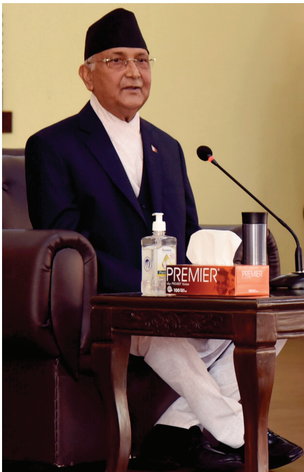
प्रधानमन्त्री केपी शर्मा ओली जननेता मदन भण्डारीको ६९औँ जन्मजयन्तीका अवसरमा आयोजित कार्यक्रममा प्रधानमन्त्री ।

प्रधानमन्त्री केपी शर्मा ओलीले नेपालको नयाँ राजनीतिक तथा प्रशासनिक नक्सा जारी गरे बापत आफूलाई हटाउन खोजिएको र त्यस्तो सपना नदेख्न चेतावनी दिएका छन् । पार्टीभित्रै अल्पमतमा परेका ओलीले स्थायी कमिटी चलिरेहकै बेला यस्तो अभिव्यक्ति दिएका छन् ।