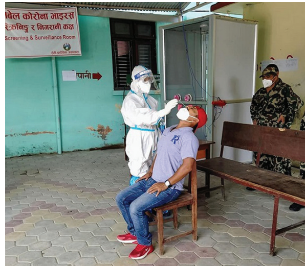
एक-एक जना संक्रमित पुष्टि भएको छ ।

गएको २४ घण्टामा ४३६ जना कोभिड-१९ का संक्रमित थपिएका छन् । स्वास्थ्य तथा जनसंख्या मन्त्रालयले आइतबार नियमित पत्रकार सम्मेलन गरी नेपालमा ४३६ जना संक्रमित थपिएको पुष्टि गरेको छ । यो सँगै, संक्रमित संख्या १२ हजार ७७२ पुगेको छ भने मृतक संख्या २८ पुगेको छ । संक्रमित मध्ये तीन हजार १३ जना निको भएर घर फर्किएका छन् । आइतबार थपिएका संक्रमित ६३ जना बाजुराका छन् । मन्त्रालयले दिएको जानकारी अनुसार, महोत्तरी (५६), गुल्मी (३८) प्यूठान (३५), दाङ (३४), नवलपुर (३१), बाग्लुङ (२९), कैलाली (१७), मोरङ (१७), रौतहट (१७), डोटी (१३), रुपन्देही (१२), धनुषा (१०), कपिलवस्तु (८), उदयपुर (६), तनहुँ (६), कास्की (५), खोटाङ (४), फापा (४), दोलखा (२), पर्वत (२), म्यादी (२) र पाल्पा (२) छन् । सिन्धुपाल्चोक, ललितपुर, गोरखा, सर्लाही, इलाम, सुनसरी, लमजुङ, रुकुम पश्चिम, सल्यान, रोल्पा, स्याङ्जा, दाचुला, डडेल्धुरामा