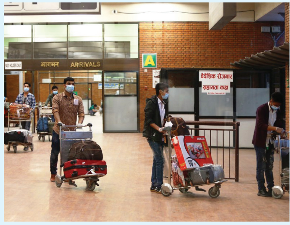
वैदेशिक रोजगार विशेष

कोरोना भाइरस संक्रमणका कारण फर्काउनुपर्ने वाध्यात्मक अवस्थामा रहेका वैदेशिक रोजगारीमा गएका कामदार र अन्यमध्ये हालसम्म करिब एक तिहाई स्वदेश फर्किन सफल भएका छन् । सरकारले गत जेठको तेस्रो सातादेखि कोरोना भाइरसका कारण समस्यामा परेका नेपाली कामदारहरूलाई स्वदेश फर्काउन शुरू गरेको थियो । फर्काउने पने अवस्थामा रहेका ३५ हजारमध्ये आइतबारसम्म ११ हजार ३ सय ७१ जनालाई स्वदेश फर्काइएको छ । केही समय अघि बसेको प्रतिनिधिसभाको अन्तराष्ट्रिय सम्बन्ध समितिको बैठकमा परराष्ट्र मन्त्री प्रदीप ज्ञवालीले ४ लाख ७ हजार नेपाली स्वदेश फर्किन चाहेका भएपनि तत्काल ३५ हजारको हाराहारीमा फर्काउनुपर्ने वाध्यता रहेको जानकारी दिएका थिए । समस्यामा रहेका नेपालीलाई फर्काउन थालिएपछि सबैभन्दा बढी कुवेतबाट आएका छन् ।