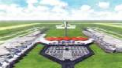
शिवराज परियार / मध्यान्ह काठमाडौं, १५ असार ।

निजगढ अन्तर्राष्ट्रिय विमानस्थल निर्माणको विषयलाई लिएर मुलुकमा केही समय अन्याय मात्रै सिर्जना भएन, विकास विरोधी फैसला गरेको भनी नागरिकस्तरबाट समेत सर्वोच्च अदालत र न्यायाधीशहरूमाथि प्रश्न उठाउने कार्य भयो । सरकारले बजेटमै यो विषय राखेर सर्वोच्च अदालतका कारण सिर्जना भएको अन्यायलाई थप दबाव सिर्जना गर्न खोज्यो ।