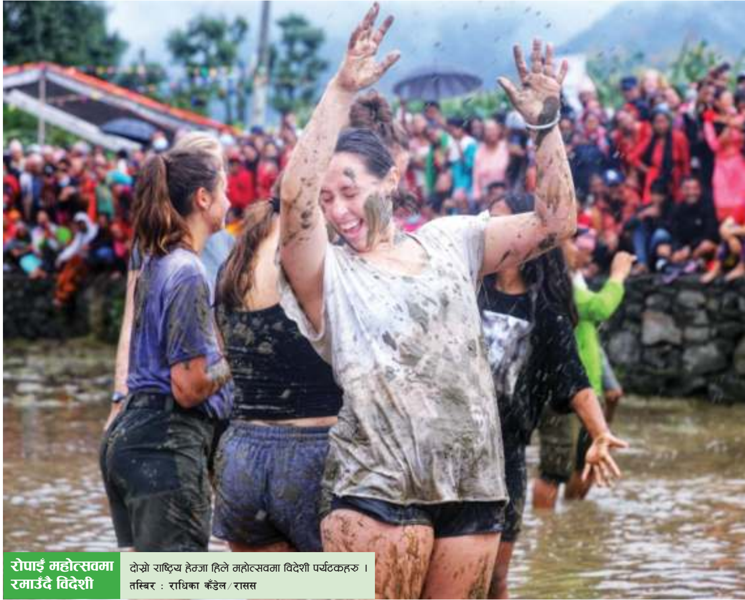
रोपाई महोत्सवमा रमाउँदै विदेशी दोस्रो राष्ट्रिय हेतजा हिले महोत्सवमा विदेशी पर्यटकहरू ।