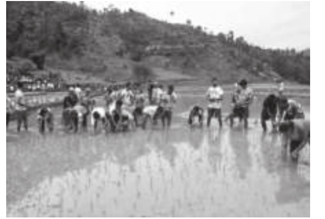
अनिष पन्थी/मध्याह्न गुल्मी, १५ असार

गुल्मीमा 'धान वालीमा जैविक विविधताको उपयोग, आयात प्रतिस्थापनमा सहयोग' भन्ने नारा सहित १९ औं धान दिवस मनाइएको छ। जनप्रतिनिधि र कर्मचारीहरूको उपस्थितिमा जिल्लाको इस्मा गाउँपालिका-६ चौरासी जाबुडुमा बुधवार औपचारिक कार्यक्रम मार्फत धान रोपिएको हो। कृषिज्ञान केन्द्र र इस्मा गाउँपालिका गुल्मीको आयोजनामा घिमिरे तथा पशुपती धान पकेट संचालक समन्वय समितिको समन्वयमा १५ रोपनी खेतमा रोपाईं गरिएको हो।