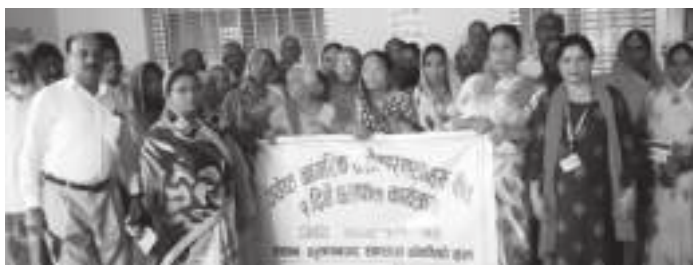
जेष्ठ नागरिकको परिभाषा, आवश्यकता, हनसक्ने दुर्व्यवहार, समस्याहरू, समस्या समाधानका उपायहरू, राज्यले दिएका सेवा

कृष्णनगर, १५ असार कृष्णनगर नगरपालिकाको जेष्ठ नागरिकमाथि हुनसक्ने दुर्व्यवहार, समस्या र समाधानका विषयमा सरोकारवालाबीच छलफल भएको छ।