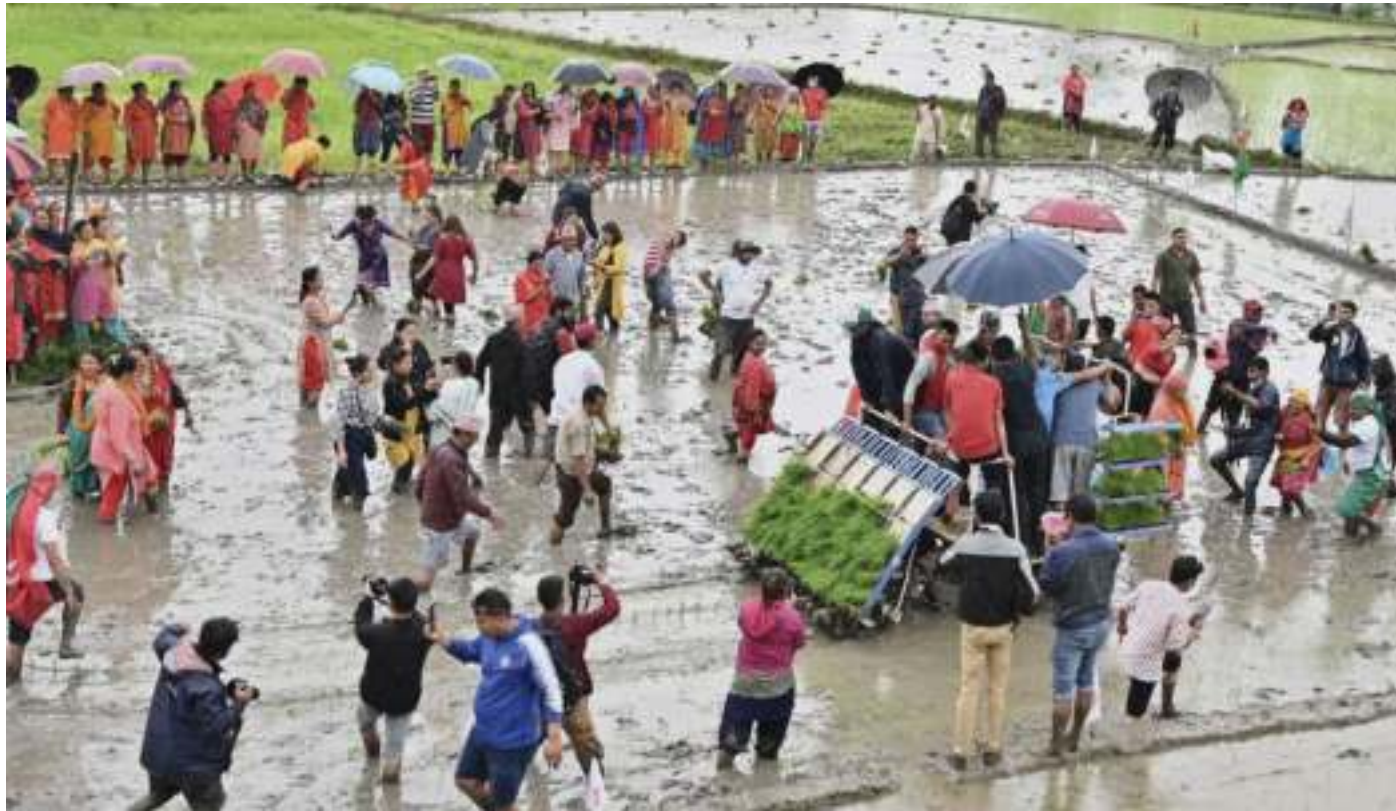
मकपुर सूचीविनायक नगरपालिकाको सिरुटारमा धान दिवसको अवसरमा बुधवार अखिल नेपाल किसान महासंघ, उपत्यका सलन्ज्य समितिले गरेको रोपाइयां नेताहरू ।