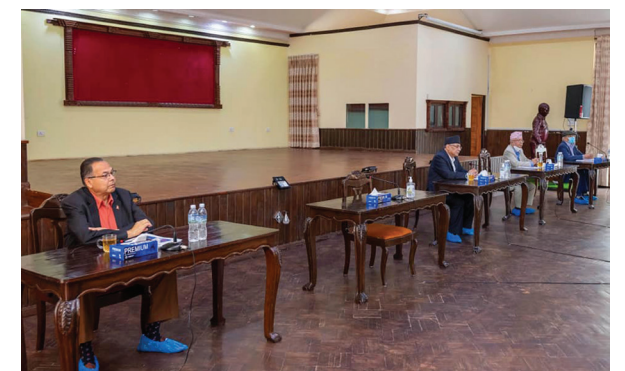
नेपाल कम्युनिष्ट पार्टी (नेकपा) को मंगलबार प्रधानमन्त्री निवास बालुवाटारमा सम्पन्न बैठकमा अध्यक्ष पुष्पकमल दाहाल प्रचण्ड लगायत नेता ।

लगातार स्थगित हुँदै आएको सत्तारूढ नेपाल कम्युनिष्ट पार्टी (नेकपा) फेरि पनि स्थगित भएको छ । गएको असार २६ गते एक साताका लागि स्थगित भएर साउन २ गते बैठक बोलाइएको थियो । तर, यो बीचमा सचिवालय बैठक बस्यो । लामो समय पछाडि बसेको सचिवालय बैठकले भने नेकपा विवादले समेत नयाँ रूप लिन पुगेको छ । साउन ३ गते प्रधानमन्त्री एवम् अध्यक्ष केपी शर्मा ओलीले विशेष महाधिवेशनको प्रस्ताव गरेपछि नेकपा फेरि एक साताका लागि स्थगित गरिएको छ । साउन ४ गते र मंगलबारका लागि बोलाइएको स्थायी कमिटी बैठक अतिरिक्त बर्षाका कारण बाढी र