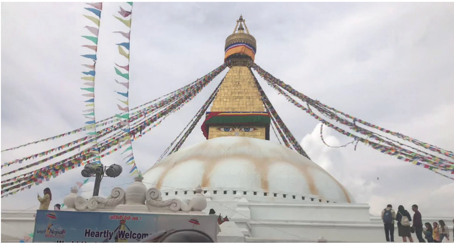
लकडाउनका कारण सुनसान बौद्ध स्तूप ।

सरकारले गएको चैत ११ गतेदेखि लागू भएको लकडाउन अन्त्य भएको छ । सरकारले आजबाट लकडाउन अन्त्य भएको जानकारी दिएको छ । सरकारका प्रवक्ता युवराज खतिवडाले लकडाउन मंगलबार रातिबाट लकडाउन अन्त्य भएको जानकारी दिएका छन् ।