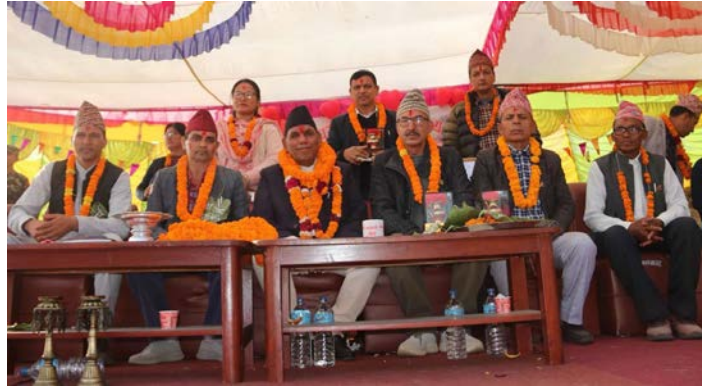
कोज्जेवाट सजग हुनुपर्छ। जनताले अर्भै प्राप्त उपलब्धि को

चितवन/मस- राष्ट्रियसभाका अध्यक्ष नारायणप्रसाद दाहालले औचित्य र आवश्यकताका आधारमा संविधान संशोधन गर्न सकिने बताएका छन्। कालिका नगरपालिका-५ स्थित श्री पदमपुर आधारभूत विद्यालय हेडौलीको ७०औं वार्षिकोत्सव एवं विद्यालय भवन शिलान्यास कार्यक्रममा बोल्दै उनले प्राप्त संविधानलाई रक्षा गर्दै औचित्य र आवश्यकताका आधारमा संशोधन गर्न सकिने स्पष्ट गरे। अध्यक्ष दाहालले भने, 'एन कानुन निर्माणमा हिलाइ हुनाले केही जटिलतामा छौं, मौलिक अधिकारको हिसाबले हामी समृद्ध छौं, तर पुरानो अवस्थातिर फर्किन