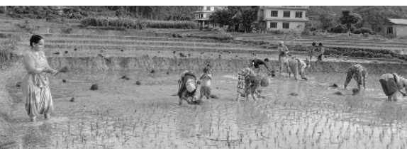
सुशीला रेग्मी/मध्याह्न रोमपुर (पाल्पा), १ साउन

दोस्रो बालीकारुपमा धान बाली पाल्पामा हालसम्म करिब ८५ प्रतिशत रोपाई सम्पन्न भएको छ। यो वर्ष असारको दोस्रो सातादेखि नै जिल्लामा धामाधम रोपाईंशुरु भएको छ।