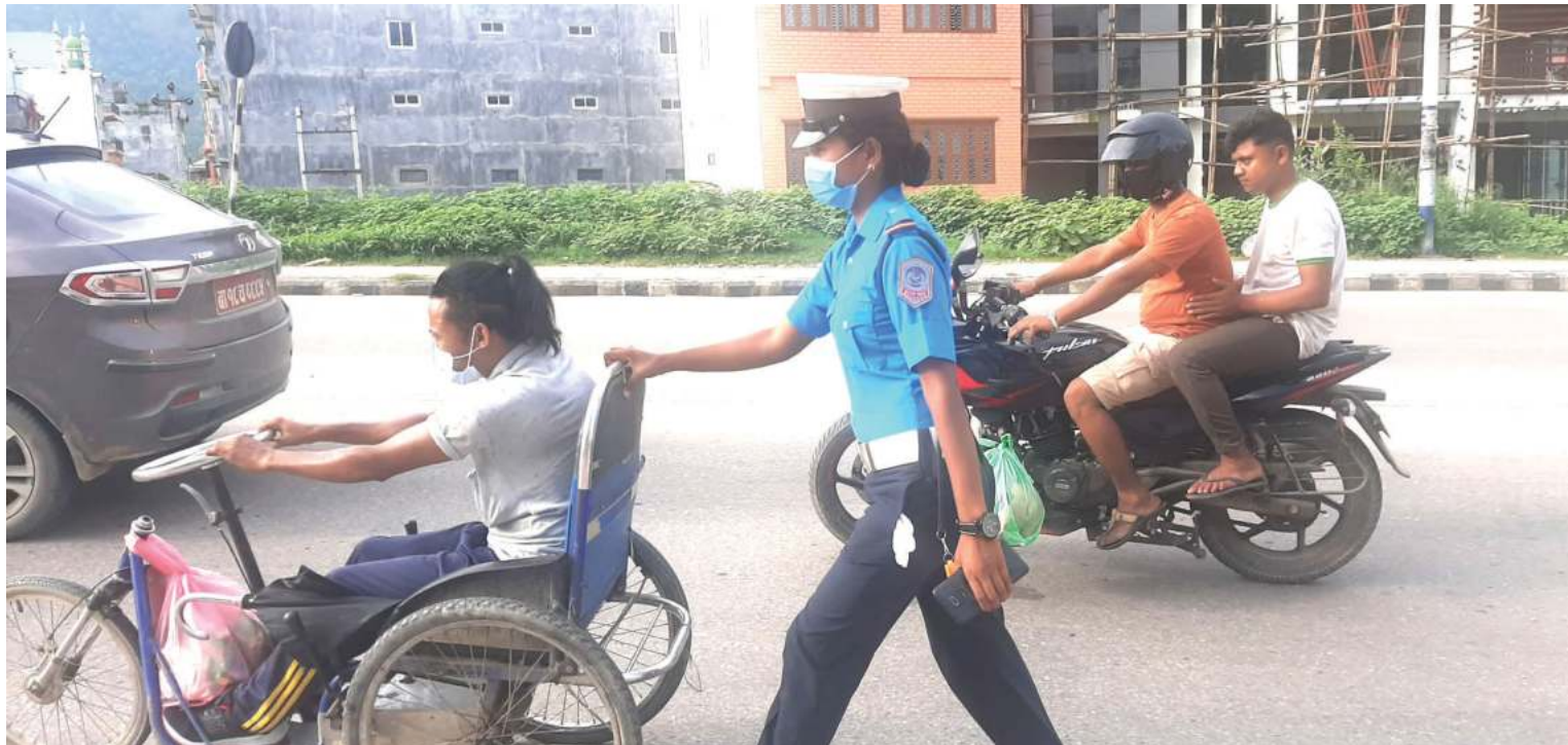
ट्राफिक प्रहरीबाट बुढवलस्थित राजमार्गमा शारीरिक अशक्तता भएका युवालाई सहयोग ।