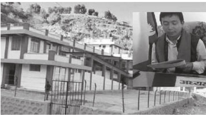
ठाउँमा स-साना निजि एवम् सरकारी स्वास्थ्य क्लिनिक तथा स्वास्थ्य केन्द्र भएपनि यस संस्थामा राम्रो डाक्टर र राम्रो उपचार

यस स्वास्थ्य संस्था दक्षिण पश्चिम रोल्पाकै एक ठूलो स्वास्थ्य केन्द्र हो। अन्य