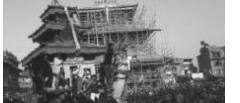
भए पनि रथ तान्ने क्रम भने रोकिएको छैन। विस्का: जात्राको अन्तिम दिन आज काठमाडौंमा रहेको भैरवनाथको रथलाई तानातान गरी माथिल्लो र तल्लो टोलामा लैजाने परम्परा रहेको छ। दुवै टोलको परिक्रमापछि, टौमडौंमा रथ पुऱ्याएपछि जात्रा सम्पन्न हुन्छ।