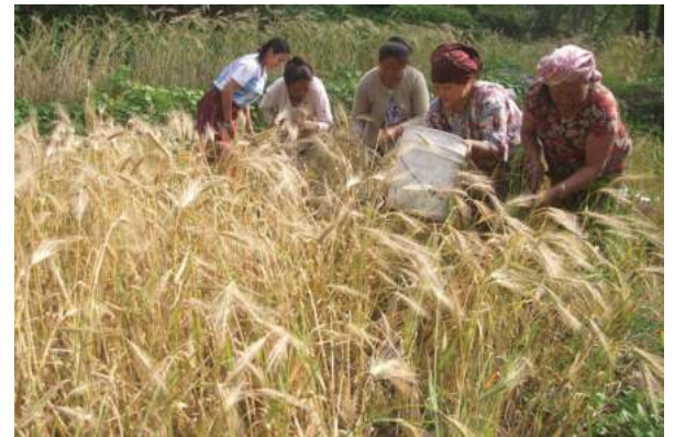
ताप्लेजुङको सदरमुकाम फुङलिङ नगरपालिका-५ फुलापते डोडागा जो टिप्दै गर्दा । विस्तारै जो सेती गर्न किसानले छोडेसँजी जो लोप हुँदै जाइको छ ।

कान्ति न्यौपाने / मध्यान्ह काठमाडौं, ५ वैशाख । आयातमा कडाई गर्ने तयारी गरेको छ ।