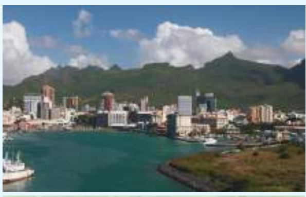
वैदेशिक रोजगार विशेष

मध्याह्न संवाददाता काठमाडौं, फागुन १७ अफ्रिकी देश मौरिससले नेपाली कामदार भित्राउन चासो दिएको छ। तर, कामदार छनोट प्रक्रिया मर्यादित हुनुपर्नेमा उसको जोड छ। शानिबार रोजगारदाता संगठनका प्रमुख तथा प्रतिनिधिहरूसँगको छलफलका क्रममा मौरिसस पक्षले कामदार छनोट प्रक्रिया मर्यादित हुनुपर्ने विषय राखेको दक्षिण अफ्रिकीको प्रिटोरियामा रहेको नेपाली दूतावासले जनाएको छ।