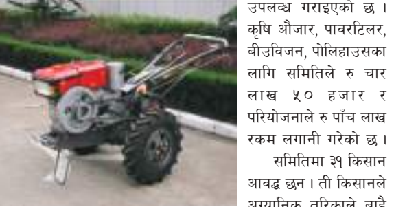
उपलब्ध गराइएको छ। कृषि औजार, पावरटिलर, बीउविजन, पोलिहाउसका लागि समितिले रु चार लाख ५० हजार र परियोजनाले रु पाँच लाख रकम लगानी गरेको छ। समितिमा ३१ किसान आवद्ध छन्। ती किसानले अत्याधिक तरिकाले बाह्र महिना तरकारी खेती गर्दै आएका छन्। यस क्षेत्रका किसानले १५ विधा बढी जग्गामा तरकारी खेती गरेका छन्। तरकारी खेतीका लागि सुन्दरीफाँटा अग्रणी रहेको छ।