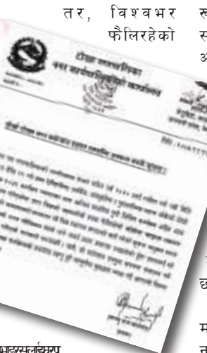
कोरोनाका कारण टोखा महोत्सव स्थगन गरेको जनाएको छ।

काठमाडौं/मस-टोखा नगर महोत्सव अन्तिममा आएर स्थगित भएको छ। विश्वभर फैलँदै गएको कोरोना भाइरस संक्रमणलाई देखाउँदै नगरपालिकाले महोत्सव स्थगन गरेको हो। नगरपालिकाले सरकारले घोषणा गरेको नेपाल पर्यटन वर्ष २०२० लाई लक्ष्य गर्दै यही फागुन २३-२५ सम्म ३ दिन टोखा नगर महोत्सव गर्ने तयारी गरेको थियो। नगरपालिकाका अनुसार, टोखा क्षेत्रका ऐतिहासिक, धार्मिक, सांस्कृतिक र पुरातात्विक महत्त्व बोकेका क्षेत्र चिनाउने उद्देश्यका साथ आयोजना गर्न लागिएको महोत्सवको तयारी करिब अन्तिम चरणमा पुगेको थियो।