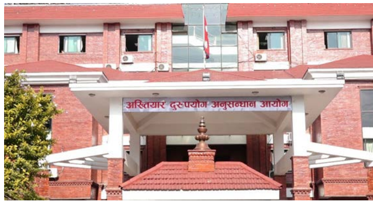
सर्वोच्च अदालतमा पुनरावेदन गरिएको आयोगका अनुसार प्रतिवादीहरू आयोगले जनाएको छ।

काठमाडौं/मस- विशेष अदालत काठमाडौंको फैसलामा चित्त नबुझेपछि अख्तियार दुरुपयोग अनुसन्धान आयोग सर्वोच्च अदालत पुगेको छ। आयोगले विशेष अदालत काठमाडौंमा दायर गरेको भ्रष्टाचारसम्बन्धी मुद्दामा विशेषले सफाई दिएपछि सर्वोच्च अदालतमा पुनरावेदन गरेको हो। अख्तियारबाट विशेष अदालतमा दायर भएका मुद्दाहरूमा विशेष अदालतबाट विभिन्न मितिमा फैसला भएका मध्ये सार्वजनिक सम्पत्ति हानिनोक्सानी र नक्कली शैक्षिक प्रमाणपत्र पेश गरी भ्रष्टाचार गरेको सम्बन्धी मुद्दाहरूमा आयोगको निर्णय अनुसार कात्तिक १७ गते