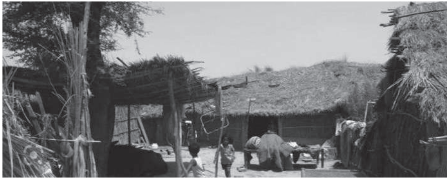
मौसम शुरु हुनासाथ गाउँका साहुमहाजनले दिने पुरानो कपडा उनीहरूको जाडो छल्ने उपाय बन्ने गर्छ।

सिरहा/मस- चिसो बढ्न थालेपछि सिरहा भगवानपुरका अति विपन्न मुसहर समुदायका चिन्ता थपिएको छ। प्रत्येक वर्ष जाडोमा कट्यागिदो दैनिकी विताने मुसहर समुदाय कसरी ज्यान जोगाउने भन्ने चिन्तामा छन्। के लगाउने, के ओछ्याउने र के ओढ्ने भन्ने चिन्ताले उनीहरूलाई सताइरहेको छ। पुस र माघको शीतलहरले मुसहर समुदाय बढी प्रभावित बनेको छ। चरम आर्थिक अभावमा रहेका उनीहरूका लागि जाडो मौसमको सहारा पराल नै बन्ने गरेको छ।