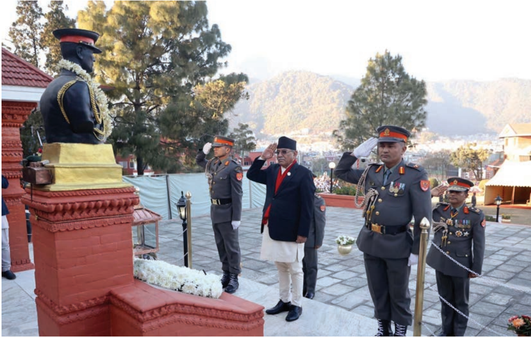
सशस्त्र प्रहरीबल नेपालको प्रधान कार्यालय हलचोकमा २२ औं सशस्त्र प्रहरी दिवसका अवसरमा सोमबार आयोजित कार्यक्रममा सलामी हुनुहुँदै प्रधानमन्त्री पुष्पकमल दाहाल "प्रचण्ड" ।