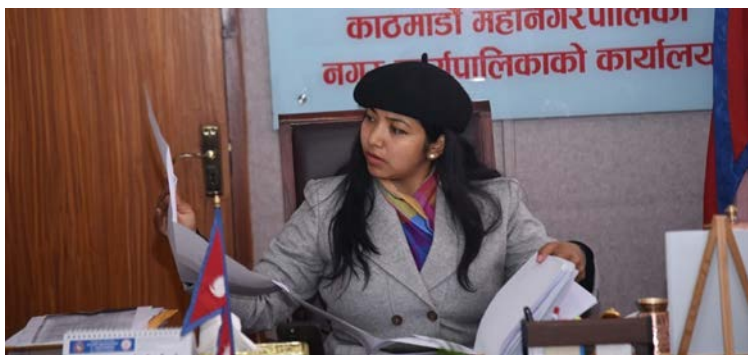
लिदै उनले कागजी प्रक्रियासहितको व्यवस्था विस्थापन गर्न आग्रह गरिन्। 'विद्युतीय कागजी दुवै प्रणाली प्रयोग हुँदा कार्य सम्पादनमा विकृति आउने