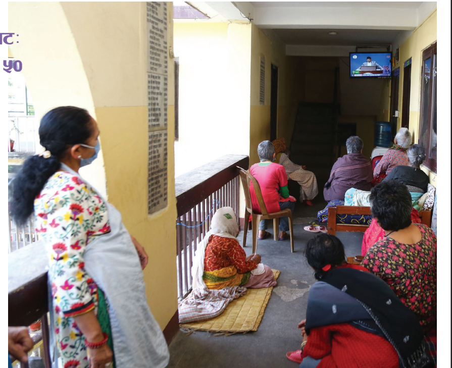
शान्तिनगरस्थित ज्येष्ठ नागरिक आवास गृहका वृद्धाहरु बिहीबार बजेट भाषण टेलिभिजनमा सुन्दै ।

मध्यान्ह संवाददाता काठमाडौं, १५ जेठ । आगामी आर्थिक वर्ष २०७७/७८ को राजस्व तथा व्ययको वार्षिक अनुमान अर्थमन्त्री डा.युवराज खतिवडाले संघीय संसदको संयुक्त बैठकमा पेश गरेका छन् । आगामी आर्थिक वर्षका लागि रु. १४ खर्ब ७४ अर्ब ६४ करोड प्रस्तुत गरिएको छ । अर्थमन्त्री खतिवडाले गत वर्ष चालु आवका लागि रु. १५ खर्ब ३२ अर्ब ९६ करोड ७९ लाखको बजेट पेश भएको थियो ।