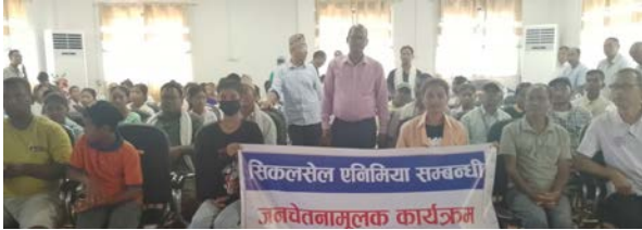
बर्दिया, २० असार