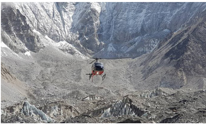
लागि अनुपम भएकाले संयुक्त राष्ट्रसंघीय (युनेस्को) ले सन् १९७९ मा प्राकृतिक शैक्षिक, वैज्ञानिक तथा सांस्कृतिक संगठन विश्व सम्पदा क्षेत्रमा सूचीकृत गरेको छ।