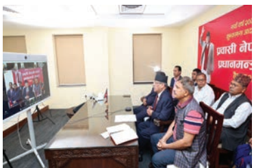
प्रवासी नेपालीलाई अर्पुअल सक्बोधन गर्दै प्रधानमन्त्री पुष्पकमल दाहाल प्रचण्ड।