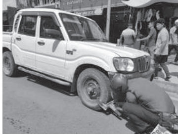
कारवाही गर्ने ?