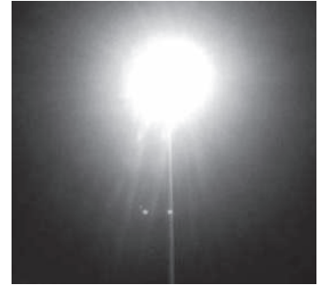
मर्मत गरेको हो।

सुखेतको वीरेन्द्रनगरस्थित दैलेख रोड चोकमा हाइमास बत्ती बिचोको करिब चार महिनापछि बलेको छ। गत वैशाखबाट बिचो वन्द भएको हाइमास बत्ती सोमबार बेलुकाबाट बलेको हो। मध्यान्ह दैनिकले आफ्नो अनलाइन स्क्रिनमा भदौ ११ गते सोमबार 'प्रदेश राजधानी वीरेन्द्रनगरमै प्रविधिको बिजोग, बल्न छाडे हाइमास बत्ती' शीर्षकमा समाचार सार्वजनिक गरेको थियो। उक्त समाचार सार्वजनिक भएको केही घण्टामै नगरपालिकाले प्राधिकरणसँग पहल गरेर उक्त हाइमास बत्ती