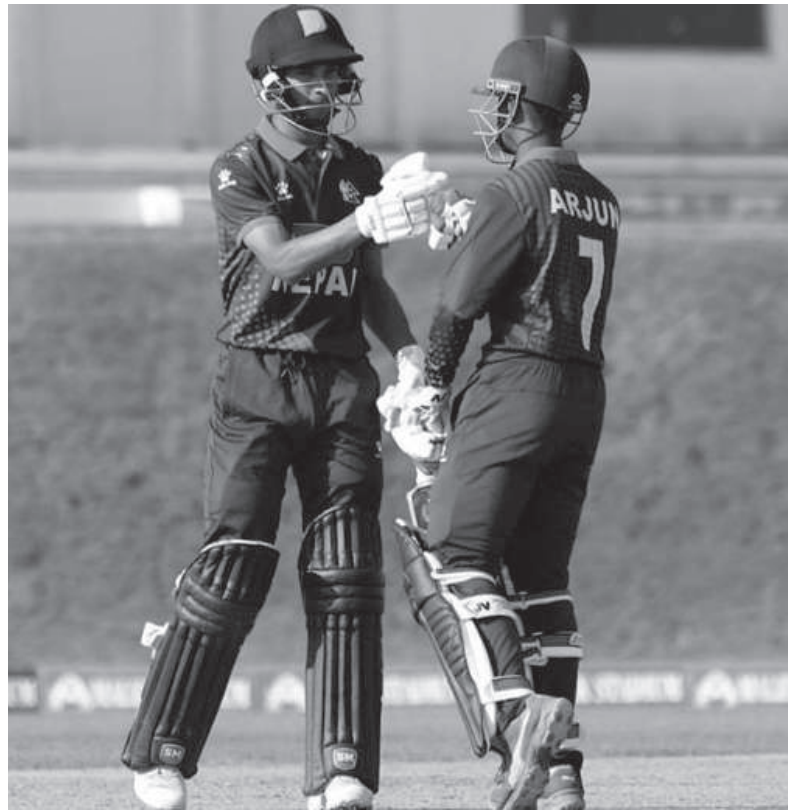
नेपालसहित सिंगापुर, कुवेत, हङकङ, मलेसिया र आयोजक यूईको सहभागिता रहेको छ। राउण्ड रोविनका आधारमा हुने उक्त प्रतियोगिताको शीर्ष टोली सन् २०२४ मा श्रीलङ्कामा आयोजना हुने यु-१९ विश्वकपका लागि छनोट हुनेछ।