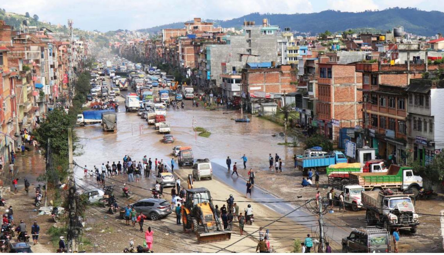
आइतबार विहानको लगातार वर्षाका कारण अरनिको राजमार्ग सडक खण्डअन्तर्गत काभ्रेपलाञ्चोकको बनेपामा फसेको सवारीसधान । लगातार परेको वर्षाका कारण राजधानी उपत्यका सहित मुलुकका विभिन्न भूभाग प्रभावित बनेको थियो ।