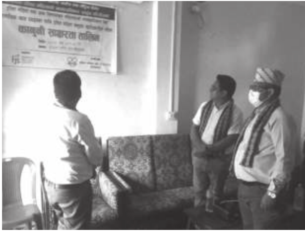
गोमती पाल/मध्याह्न महिना, २१ भदौ।