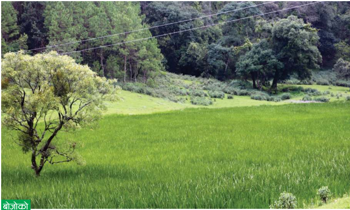
बोजोको खेती । डोटीको जोरायल गाउँपालिका-२ धारापानीमा गरिएको बोजो खेती ।