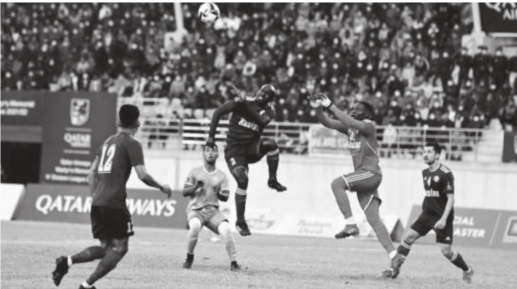
मध्यान्ह संवाददाता काठमाडौं, ४ मंसिर

■ च्यासल ३-० ले पराजित, संकटा र हिमालयनको बराबरी