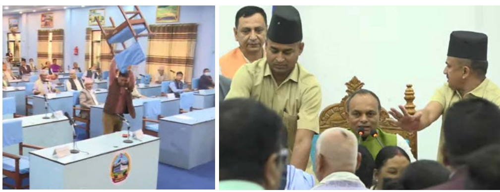
२०७७ असोज १९ गते लुम्बिनी प्रदेश सभामा भएको तोडफोड (बायाँ) । काठमाडौं मधेश प्रदेश सभामा जनमतको आसलत सांसदहरू पुगेको दृश्य (दायाँ) ।

नारावाजी गडै सभामुख बसेको स्थान र पोजिङममा