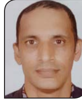
● भरतमणि ज्वाली