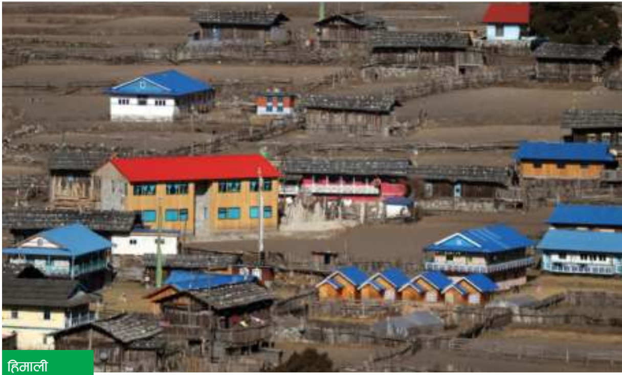
हिमाली गाउँ घुन्साका घर तथा होटल

ताप्लेजुङको फक्ताङलुङ गाउँपालिका-६, कञ्चनजङ्घाको प्रवेशद्वार मानिने घुन्सावासीका घर तथा होटल ।