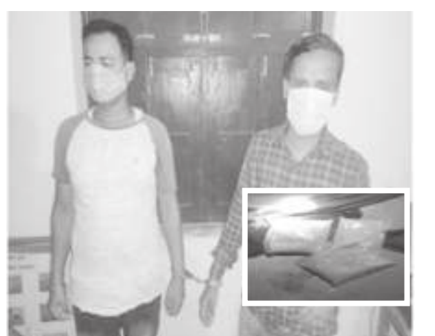
दिए। आवश्यक कारवाहीका लागि पक्राउ परेका दुवै जनालाई ईलाका