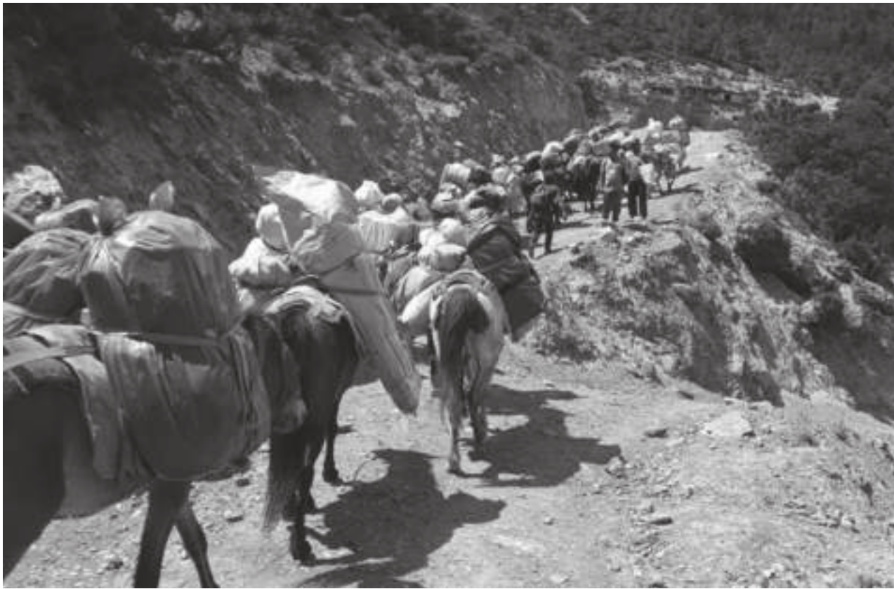
मुस्ताङको माफदिसि क्य्याादीस्थित धौलागिरि हिमाल आरोहण गर्नआएका आरोहीका सामग्री खचवडमा बोकाएर ढुवानी गरिँदै।