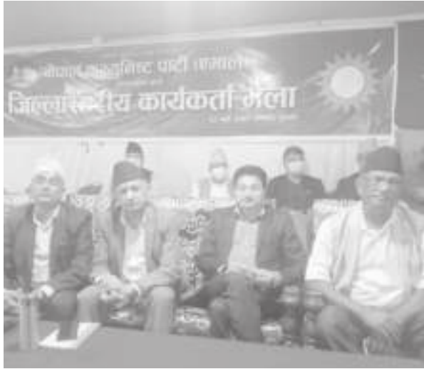
ल्याइ संसदको भोटबाट केपी ओली प्रधानमन्त्रीबाट हटेको नभइ

भेलामा नेकपा एमालेका प्रवक्ता एवं गुल्मी क्षेत्र नं. १ का सांसद ज्ञवालीले आफूहरूको पार्टी नेकपा एमालेले आफ्नै शक्तिमा विश्वास गर्ने बताए। उनले सरकार परिवर्तन संसदीय व्यवस्थापनमा भइरहेको बताउँदै सदनमा अविश्वासको प्रस्ताव