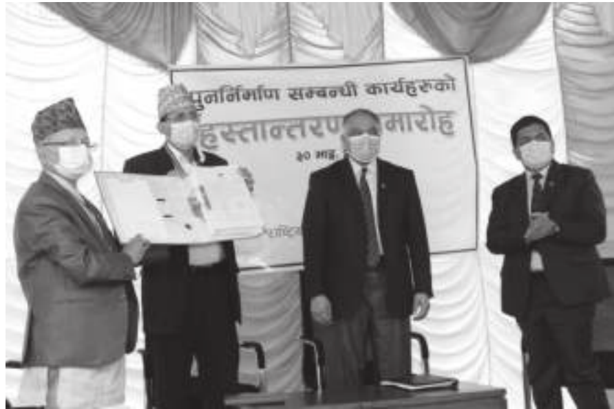
पुनःनिर्माणका बाँकी काम सम्बन्धित निकायले निष्कर्षमा पुऱ्याउने बताए। सम्बन्धित कार्यालयलाई समग्र संरचना नै हस्तान्तरण गरिएको उनले बताए।

प्राधिकरणमा आयोजित कार्यक्रममा निजी आवास तथा वस्ती विकासतर्फको वित्तीय एवं प्राविधिक व्यवस्थापनसहितका पुनःनिर्माणसम्बन्धी बाँकी काम सहर विकास मन्त्रालय र सहर विकास तथा भवन निर्माण विभागलाई हस्तान्तरण गरिएको छ। सरकारी एवं सार्वजनिक भवन, स्वास्थ्य संस्था र केन्द्रीय आयोजना कार्यान्वयन एकाइ (भवन)मार्फत सञ्चालित सम्पदा एवं गुम्बाको पुनःनिर्माणसम्बन्धी काम पनि सहर विकास मन्त्रालय मातहत नै हस्तान्तरण भएको छ।