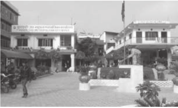
तेजबहादुर वन/मध्यान्ह इटहरी, ३२ साउन

समुदाय स्तरबाट नियन्त्रण वाहिर पुगेको दोस्रो लहरको कोरोना संक्रमणका कारण प्रदेश १ का अधिकांश जिल्ला अन्तर्गत स्थानीय तहहरूमा धमाधम लकडाउन हुन थालेका छन्। प्रदेश १ को भुजा, मोरङ, धनकुटा, इलाम लगायतका जिल्लाहरूका अधिकांश स्थानीय तहहरूमा लकडाउन जारी रहेको छ।