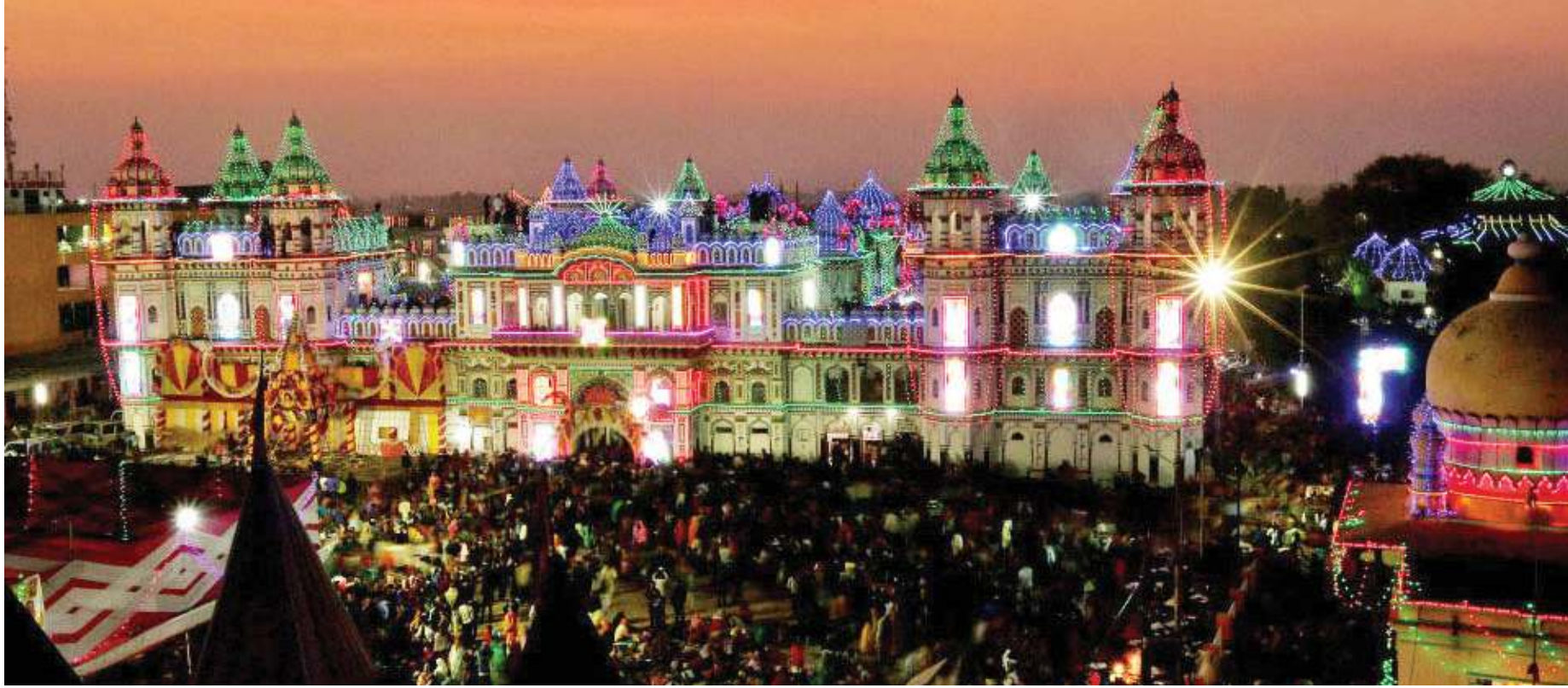
छठ पर्वका अवसरमा सजाइएको जानकी मन्दिर । बुधबार अस्ताउँदो सूर्यलाई अर्घ दिइर छठ मनाइएको छ ।

ई-पत्रिका अनलाइन पढ्नका लागि क्यूआर कोड स्क्रान गर्नुहोला।