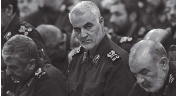
मोहिनी मिश्र रिवाल बगदाद, १९ पुस

इराकको राजधानी बगदादको अन्तर्राष्ट्रिय विमानस्थलनाजिकै शुकवार एकजना इरानी सैन्य कमाण्डर मारिएपछि यस विषयले खाडी क्षेत्रमा नै हलचल ल्याइदिएको छ। अमेरिकी सेनाको कारवाहीमा उनी मारिएपछि अमेरिका र इरानबीचको पछिल्लो तनाव भन्ने चर्किले देखिएको छ।