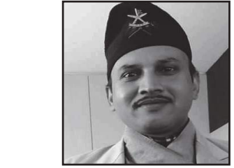
ज्ञानमणि नेपाल कालोटोपी

मिथिला संस्कृति यहाँको मूल संस्कृति हो । जनकपुरको जानकी मन्दिर प्रदेशको मात्र नभएर देशकै ठूलो विशेषता बोकेको धार्मिक गन्तव्य हो ।