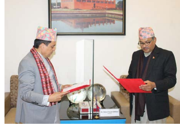
ग्लोबल आइएमई बैंकलाई नेपाल राष्ट्र बैंक र यसको नेतृत्वले अहिलेको अवस्थामा पुऱ्याउने पुऱ्याएको स्मरण गर्दै उनले बैंक