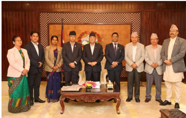
बुधवार प्रधानमन्त्री प्रचण्डलाई राजीनामा बुझाएपछि तस्वीर खिचाउँदै एमालेका मन्त्रीहरु ।

ओलीले सरकारलाई दिएको समर्थन बुधवारकै मितिदेखि लागू हुने गरी फिर्ता गरिएको उल्लेख गरेका छन् । समर्थन