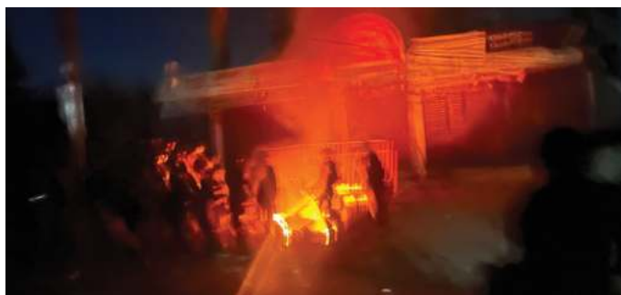
सुरक्षितस्थित हुनालेको पार्टी कार्यालयमा प्रदर्शनकारीले आगजनी गरेको छ ।