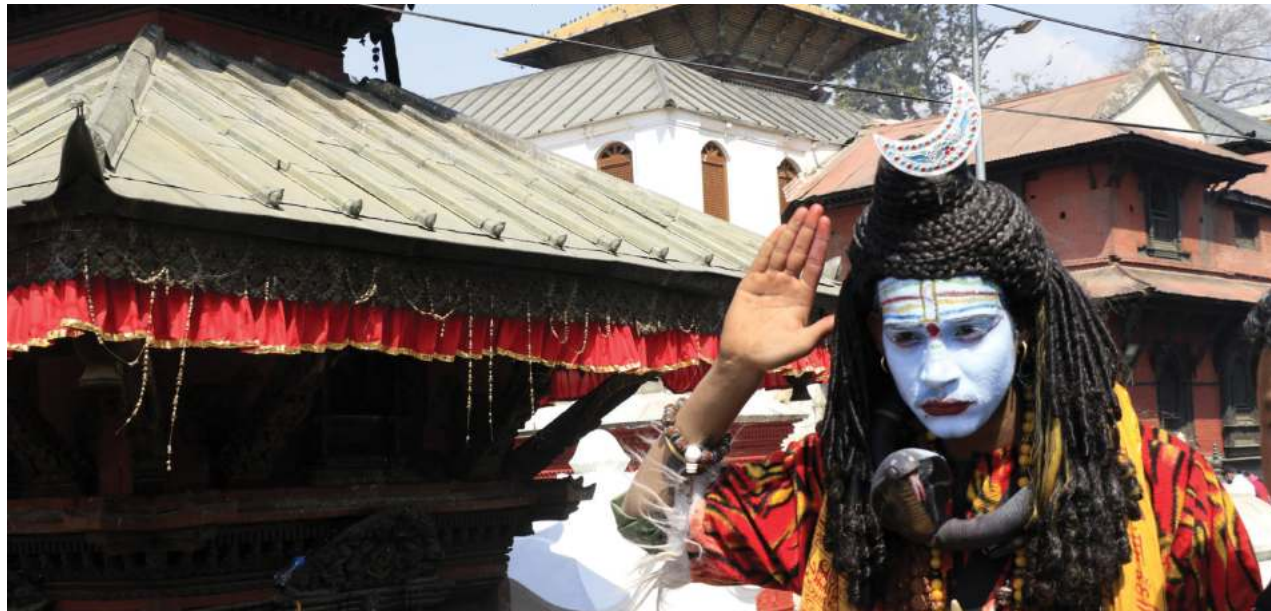
शिवरात्रिको पूर्वसन्ध्यामा विभिन्न स्थानबाट पर्याप्त गण्डिद्वारा साधुसन्त आइपुगेका छन् ।