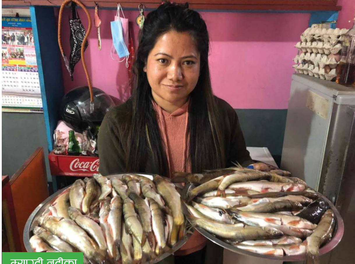
म्याग्दी नदीका असला माछा

म्याग्दी नदीका असला माछा जाहाकलाई देखाउँदै तातोपानी तुलाचन होटल छण्ड थकाली मान्सा घरकी सञ्चालिका मना तुलाचन ।