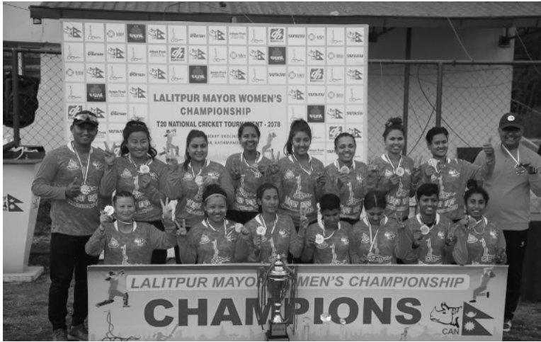
मध्याह्न संवाददाता काठमाडौं, १६ फागुन

विभागीय क्लब एपीएफले ललितपुर मेयर कप टी-२० महिला क्रिकेट प्रतियोगिताको उपाधि जितेको छ। त्रिवि क्रिकेट मैदानमा सोमबार भएको फाइनल खेलमा सुदूरपश्चिम प्रदेशलाई ८ विकेटले पराजित गर्दै एपीएफले उपाधि जितेको हो। एपीएफले लगातार दुई संस्करणको उपाधि जित्दा दुवै संस्करणमा सुदूरपश्चिम प्रदेश उप विजेतामा सीमित