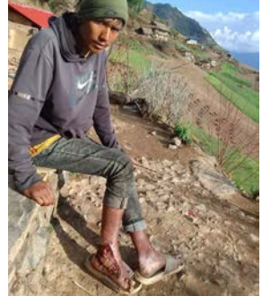
प्रचण्ड खत्री/मध्यान्ह रुकुम पश्चिम, २२ फागुन

रुकुम पश्चिमको बाँफिकोट गाउँपालिका वडा नम्बर ५ लेखावाडका चक्रमिलन घर्ती छोरे रोगले ग्रसित छन्। घरको आर्थिक