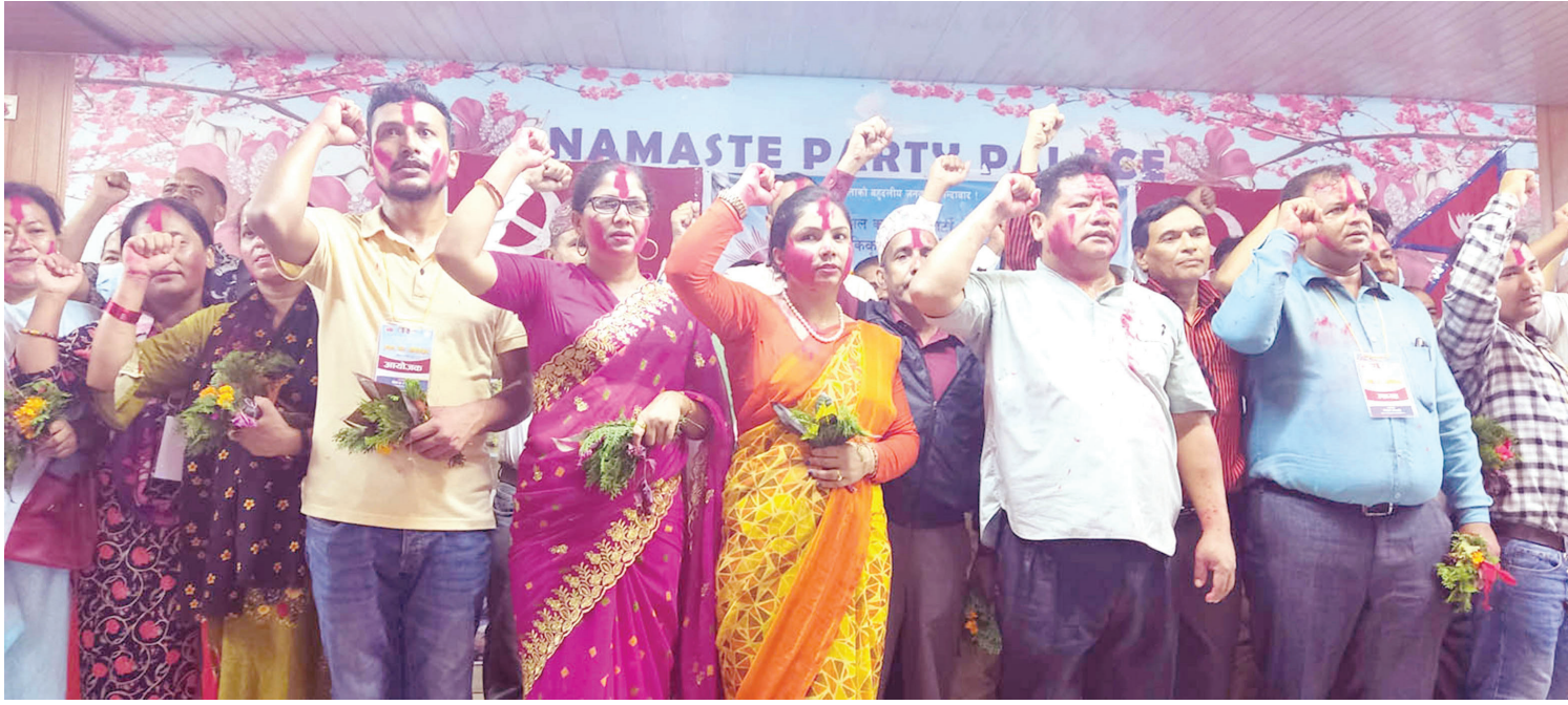
सर्वसम्मति निर्वाचित नेकपा एमालेको बुटवल उपमहानगर कमिटी वडा नम्बर १३ को कार्यसमिति। शनिबार ६ हजार बढी वडाका अधिवेशन भएको घनालेले जनाएको छ।

दीवाकर अधिकारी/मध्यान्ह काठमाडौं, ६ कात्तिक