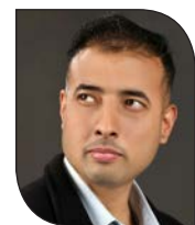
● अपूर्व नेपाल

माध्यमबाट विभिन्न सूचना र सेवाबारे जानकारी प्राप्त गर्न सकिने व्यवस्था गरिएको छ।