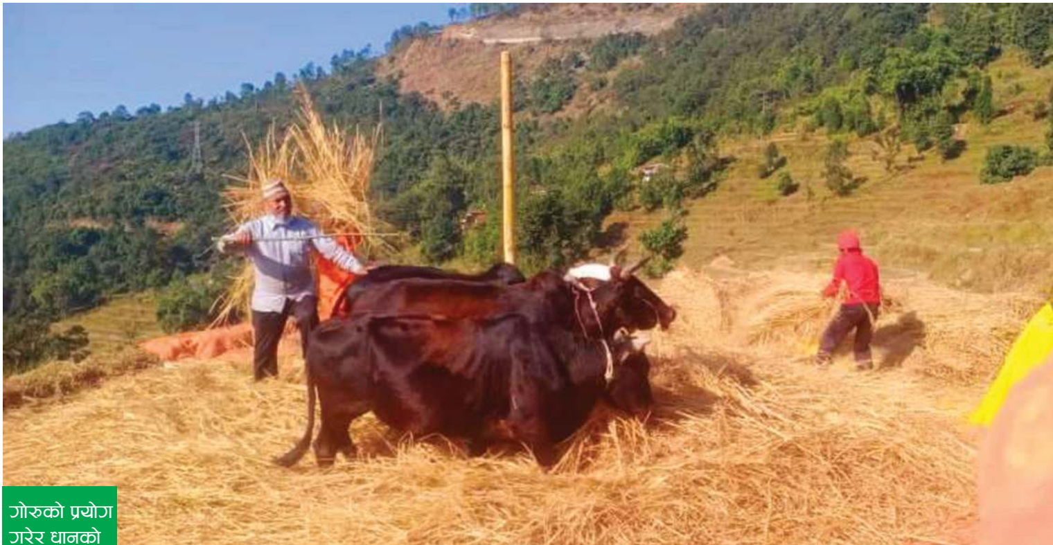
गोरुको प्रयोग गरेर धानको दाईं हाल्दै

पोखरा-२८, लामातारीका स्थानीय किसान दाईं हाल्दै। पछिल्लो समय श्वेसरको प्रयोग बढेसँगै दाईं संस्कृति कम हुन थालेको छ।