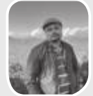
● तिर्थ प्रसाई

अस्थायी प्राध्यापकलाई खोपी प्रतिस्पर्धाको भेलेली नाटकद्वारा स्वतः स्थायी गरिने रे ! भनेपछि अब कसैले म कवि हुन्छु भन्नासाथ स्वतः कवि, सांसद हुन्छु भन्नासाथ स्वतः सांसद र विद्यावारिधि गर्छु भन्नासाथ स्वतः डाक्टर हुने भो हैन ? यो स्वतः को नाटकले भुईँफुट्टाको भीड पो बढाउने भो गहिँ !