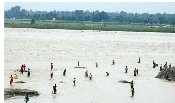
महाकाली नदीमा बाढीसँगै बगेर आउने काठ एवं दाचुरा संकलन गर्न महाकाली नदीमा पुगेका कञ्चनपुरको भीमवत्तनगरपालिका-१३ का स्थानीय।

सोमबार मात्रै तीन जनाको मृत्यु भएको प्राधिकरणले जनाएको छ। कालिकोट, दाचुला र काठमाडौंमा एक-एक जनाको मृत्यु भएको हो। काठमाडौंको कागेश्वरी मनहरा नगरपालिका-१ गगलफेदीमा पहिरोमा परिएर एक जनाको मृत्यु भएको छ भने कालिकोटको पचालभरना