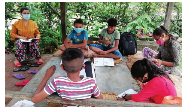
पाल्पाको रामपुर नगरपालिका क्षेत्रमा टोलटोलमै पढाउन थालिएको छ । कोभिड-१९ को संक्रमण फैलिँदै गएपछि विद्यालय बन्द गरिएको छ ।

उनी दुई साता प्रदेश अस्पतालको आइसोलेसनमा बसेका थिए । कोरोना निको भएपछि उनी फर्किसकेका छन् । समुदायमा कोरोना भाइरसको सङ्क्रमण फैलिएको उदाहरण यतिमै सीमित छैन । डोल्पाको जगदुल्ला गाउँपालिकाका ५८ वर्षीय पुरुषको कोरोना भाइरस सङ्क्रमणका कारण मृत्यु भयो । उनी न भारतबाट आएका थिए, भारतबाट फर्केका