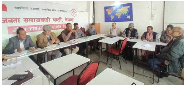
फिर्ता लिनेबारेमा कुनै निर्णय नभएको बताए। अहिले पनि सरकारलाई समर्थन कायमै रहेको जानकारी उनले दिए।

बैठकले भ्रष्टाचारको अन्त्य, सुशासन कायम, विकास र संविधान संशोधनका लागि वर्तमान सरकार असक्षम रहेको निष्कर्ष निकालेको छ। प्रवक्ता मनिष सुमनले सरकारलाई दिएको समर्थन