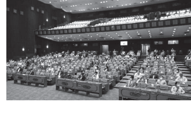
छलफलमा उठेका विषयमा स्पष्ट पार्दै

काठमाडौं/मस- प्रतिनिधिसभाको बैठकमा राष्ट्रियसभामा उपलब्ध भएको योगमाया आयुर्वेद विश्वविद्यालय विधेयक, २०७९ पारित भएको छ। शिक्षा, विज्ञान तथा प्रविधिमन्त्री देवेन्द्र पौडेलले प्रतिनिधिसभाको शिक्षा तथा स्वास्थ्य समितिमा विधेयकमाथि भएको दफावार छलफलको प्रतिवेदनसहित छलफलका लागि प्रस्ताव गरेपछि उक्त विधेयक सर्वसम्मतिबाट पारित भएको हो।