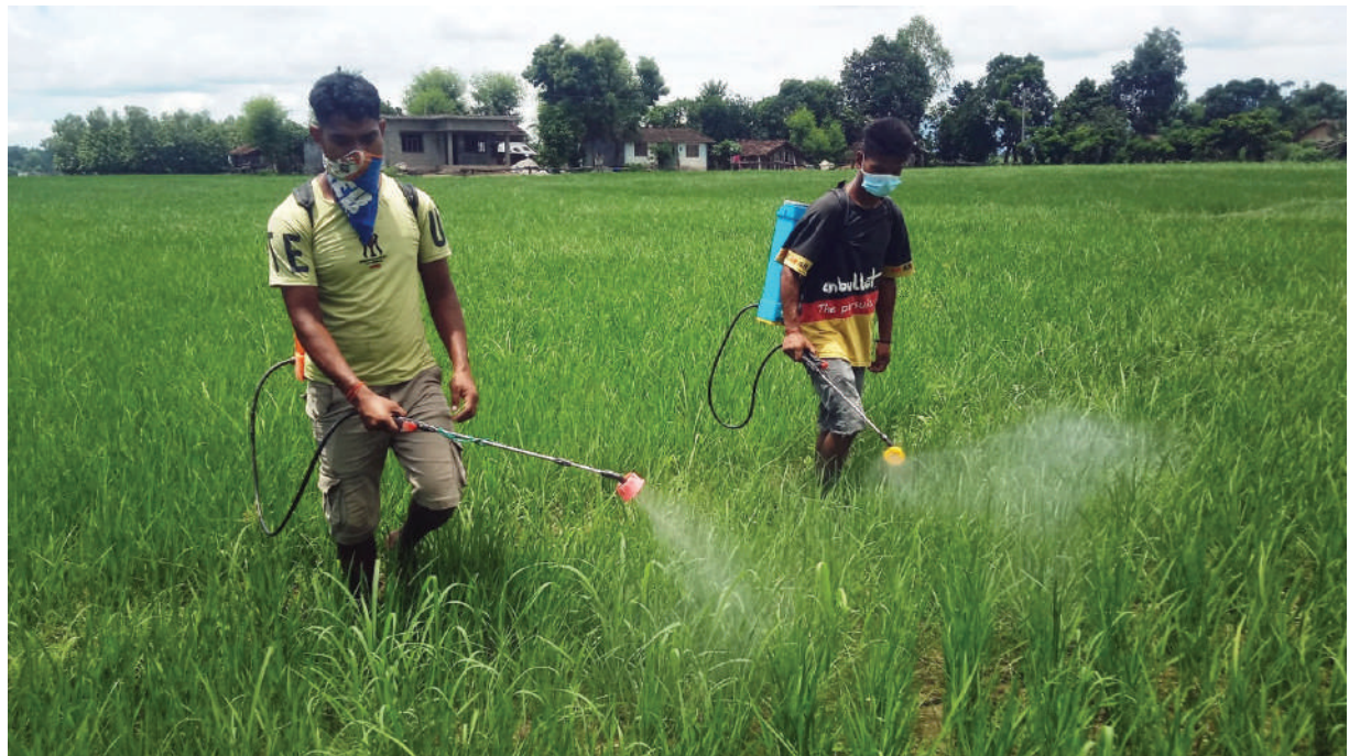
धानमा बिषादी छर्कदै । शुक्लाफाँटाका किसान धान खेतमा घाँस मार्ने बिषादी छर्कदै

त्यस्तै, हिमालयन रि इन्स्योरेन्स कम्पनीको साधारण सभाले पनि प्रिमियम मूल्यमा आईपीओ सेयर निष्काशन गर्ने निर्णय गरेको छ । कान्तिपुर टेलिभिजन नेटवर्कले पनि प्रिमियम मूल्यमा ७ लाख ५० हजार फिता सेयर जारी गर्ने तयारी गरेको छ । हालसम्म अरुण भ्याली, शिवम सिमेन्ट, रुरु जलविद्युत परियोजना लगायतका कम्पनीले प्रिमियम मूल्यमा आईपीओ जारी गरिसकेका छन् भने विभिन्न कम्पनीले प्रिमियम मूल्यमा एफपीओ पनि जारी गरिसकेका छन् ।