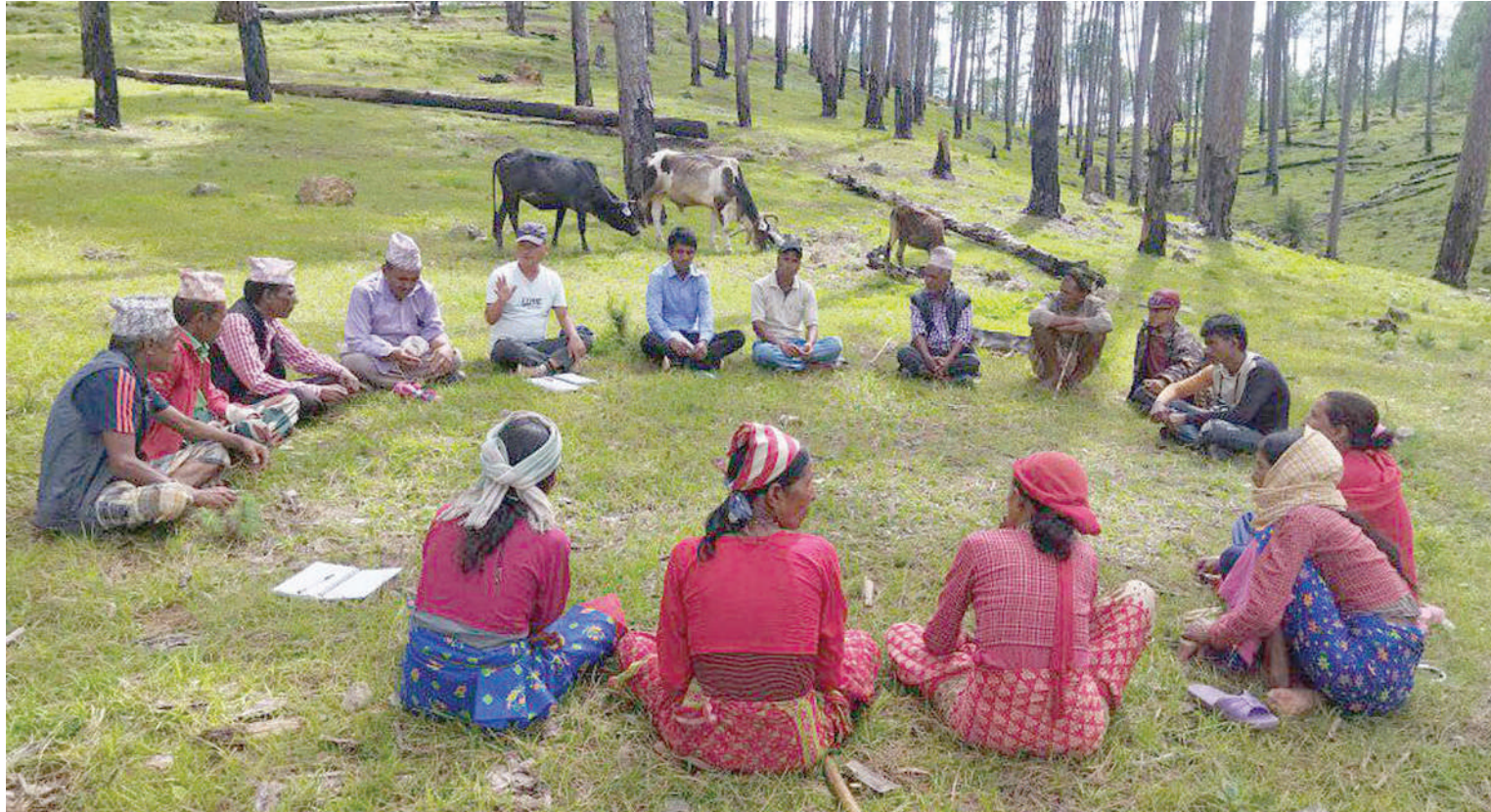
डोटीको जोगराज गाउँपालिका-२ मा रहेको बाघजोला र सल्लेसाइ सावुनाथिक वन उपमोक्षा समितिबीच वनका विषयमा भएको विवादका विषयमा वनतै बसेर छलफल गर्दै उपमोक्षा ।