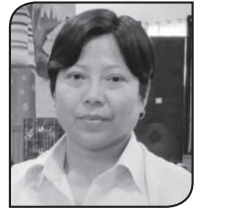
● सरस्वती मोहोरा

मुख्य कुरा प्रेमको स्वरूप एकनिष्ठ हुनुपर्छ। प्रेम एक समयमा केवल एक व्यक्तिसँग मात्र हुनसक्छ र त्यसो हुनु भनेको प्रेमको स्वरूप एकनिष्ठ हुनु हो। निजीसम्पत्ति आधारित पितृसत्तात्मक व्यवस्थाअन्तर्गत पुरुषप्रतिको स्त्रीको मात्रै एकनिष्ठता हुनु भने सही प्रेम होइन। त्यो पितृसत्ताले जबरजस्ती महिलासमाथि थोपरेको महिलाले बाध्यतामूलक निर्वाह गर्नुपर्ने कर्तव्य हो। सो निजी सम्पत्ति नरहेको अवस्थामा त्यस्तो बाध्यताबाट स्त्रीहरू मुक्त हुन्छन्। स्त्री-पुरुष मुक्त रहेको अवस्थामा