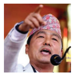
सरकारमा जान राप्रपाले राखेको "सार्वजनिक पद धारण गरेकाहरूको सम्पति छानविन गर्ने सर्त" सरकारको नेतृत्वकर्ता दल माओवादी केन्द्रको चुनावी एजेण्डासँग समेत मिल्दछ ।

मिश्रले नै मंगलवार फेसबुकमा सरकारमा जान पुस २७ लाई राष्ट्रिय एकता दिवस घोषणा गर्नुपर्नेसहितका ३ वटा शर्त राख्नुपर्ने धारणा सार्वजनिक गरेका थिए । बुधवार कार्यसम्पादन समितिका बहुसंख्यक सदस्यले भने सरकारमा जानुपर्ने बताएपछि उनको समेत सर्त समेटेर सरकारमा जाने निर्णय भएको हो । प्रचण्डको नेतृत्वमा आठ सदस्यीय मन्त्रिमण्डल गठन गर्दा राप्रपा सहभागी भएको छैन तर पार्टीभित्र सरकारमा जानुपर्ने आवाज बलियोरूपमा उठेपछि राप्रपाले न्यूनतम साभ्ना कार्यक्रममा आफ्ना सर्तहरू पूरा गर्ने प्रतिवद्धता ठूला सत्ता साझेदार दलबाट गराएर सत्तारोहण यात्रा तय गर्न लागेको हो ।