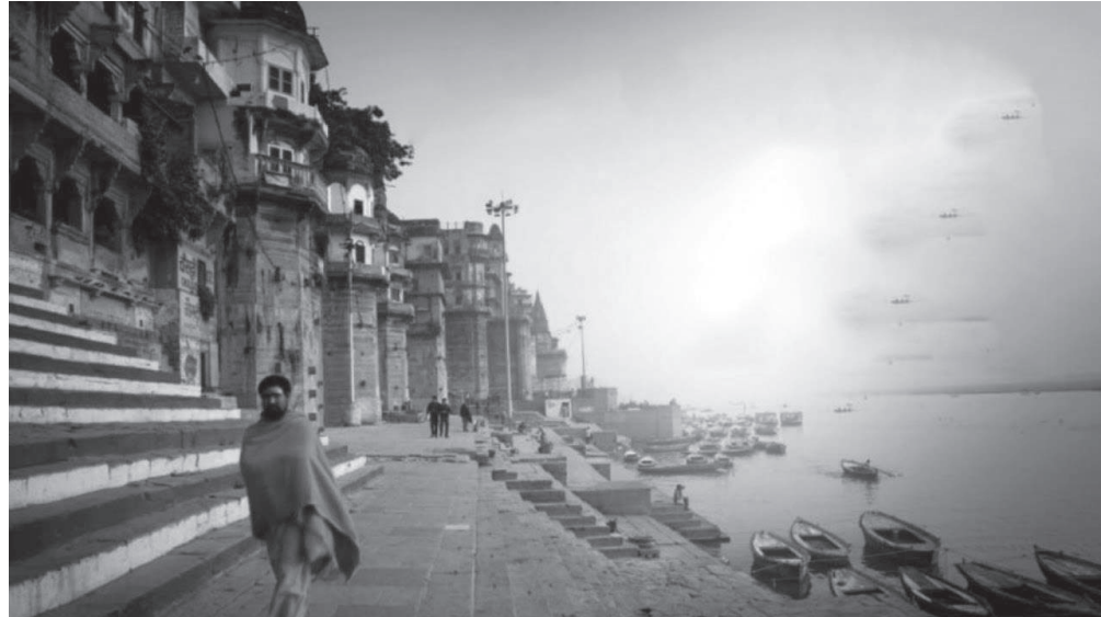
जति प्रयत्न गरे पनि संसारका स्थावर तीर्थ सबै भेट्न सकिन्न, त्यसैले स्कन्द पुराणले भनेको छ 'सत्यतीर्थ क्षमा तीर्थ तीर्थ मिन्द्रियनिग्रहः सर्वभूत दया तीर्थ तीर्थच प्रियवादिता, ज्ञान तीर्थ तपस्तीर्थ कथितं तीर्थ सप्तकम्'। अर्थात् मानिसको विधि व्यवहार सत्यवादिता, अरूपतिको क्षमाभाव, आफ्ना इन्द्रियहरूलाई शमन, सबै प्राणीप्रतिको दया, प्यारो र मिठो बचन, ज्ञान प्राप्ति र वितरण, मन, वचन र कर्मप्रतिको तप यी सात प्रकारका तीर्थ यात्रा जरूरी छ।

यत्राच्युतोद्धार कथा प्रसंग। अर्थात् कालिमा स्थावर तीर्थमा प्रदुषण बढेछ, प्रदुषण भन्नु नै पाप हो त्यसैले तीर्थ त्यहीँ हुन्छ जहाँ भगवत् सेवा, चर्चा, चिन्तन, कथा प्रसंग, लीला अवतार प्रसंग र तिनका नाम जहाँ लिइन्छ त्यहीँ तीर्थ हुन्छ र शास्त्रकारहरूले यसैलाई जंगम तीर्थ भनेका हुन्। हजारौँ योजन (एक योजन बराबर चार कोश) टाढाबाट गंगाको नाम लिएर पनि सबै किसिमका पाप, कल्मषहरू हट्ने छन् भनिएको छ 'गंगा गंगेति यो ब्रूयात् योजनानां शतैरपि मुच्यते सर्व पापेषुः विष्णुलोकं स गच्छति'। मूल कुरा शास्त्रको भनाइ यन्त्रिय निग्रह हो, नीतिले भनेको छ 'आपादां कथित मार्गमिन्द्रियाणामशंयम तज्जय सुकृतं मार्गं येनेष्टं तेन गम्यताम्' अर्थात् इन्द्रिय अशंयमी हुनु भनेको कुमार्ग र त्यसमार्थिको विजय भनेको सुमार्ग हो जुन मन लाइन्छ त्यही अन्नाऊ किनभने शास्त्र शस्त्र भएर आउँदैन बाटो मात्रै देखाउँछ।