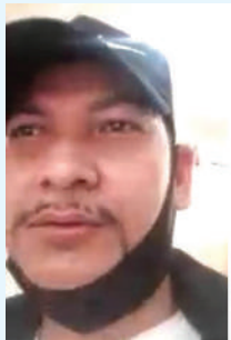
मध्यान्ह संवाददाता काठमाडौं, १३ पुस

भारतको राजधानी नयाँ दिल्लीमा बसेर युरोपेली देशमा वैदेशिक रोजगारीका नाममा युवाहरूलाई ठगी गर्ने गरिएको पाइएको छ । दिल्लीमा बसेर एक गिरोहले युरोपेली मुलुक स्पेनमा आकर्षक तलबसहितको रोजगारीमा पठाइदिने प्रलोभन दिएपछि स्याङ्जामा मानव तस्करीको जालो नै फेलाइएको र त्यस जालोमा केही युवाहरू परेको पाइएको हो ।