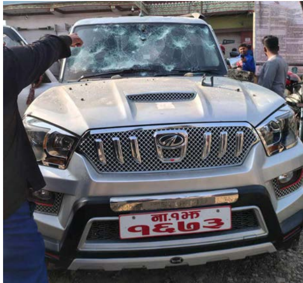
ओमप्रकाश यादव/मध्याह्न रौतहट, ११ पुस

रौतहट गरुडा नगरपालिकाको कार्यालयमा तोडफोड भएको छ। शिक्षक सरुवाको विषयलाई लिएर नमुना माध्यमिक विद्यालय गरुडाका विद्यार्थीहरूले बिहीबार नगरपालिका कार्यालयमा तोडफोड गरेका हुन्।