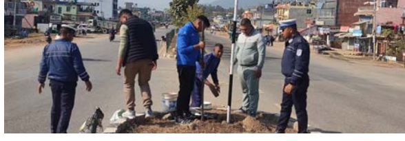
सुर्खेत/मस-जिल्ला ट्राफिक प्रहरी कार्यालय सुर्खेतले रत्न राजमार्ग र कर्णाली राजमार्गमा सवारी दुर्घटना न्यूनीकरणका लागि दुर्घटनाको बढी जोखिम रहेका सडक छेउछाउमा चेतनामूलक (गति सीमित) बोर्ड राखिएको छ।

गति ३० किलोमिटर प्रति घण्टा लेखिएको छ। बोर्डहरू सुब्बाकुना, धुलिचाबि, पिपरा, एयरपोर्ट, खजुरा, दैलेख रोड, बसपार्क, मंगलगाँ, चाँदना पुल, एरिचोक, मुलपानी, रडियो नेपाल र टेम्पु पार्क चोकमा राखिएका छन्।